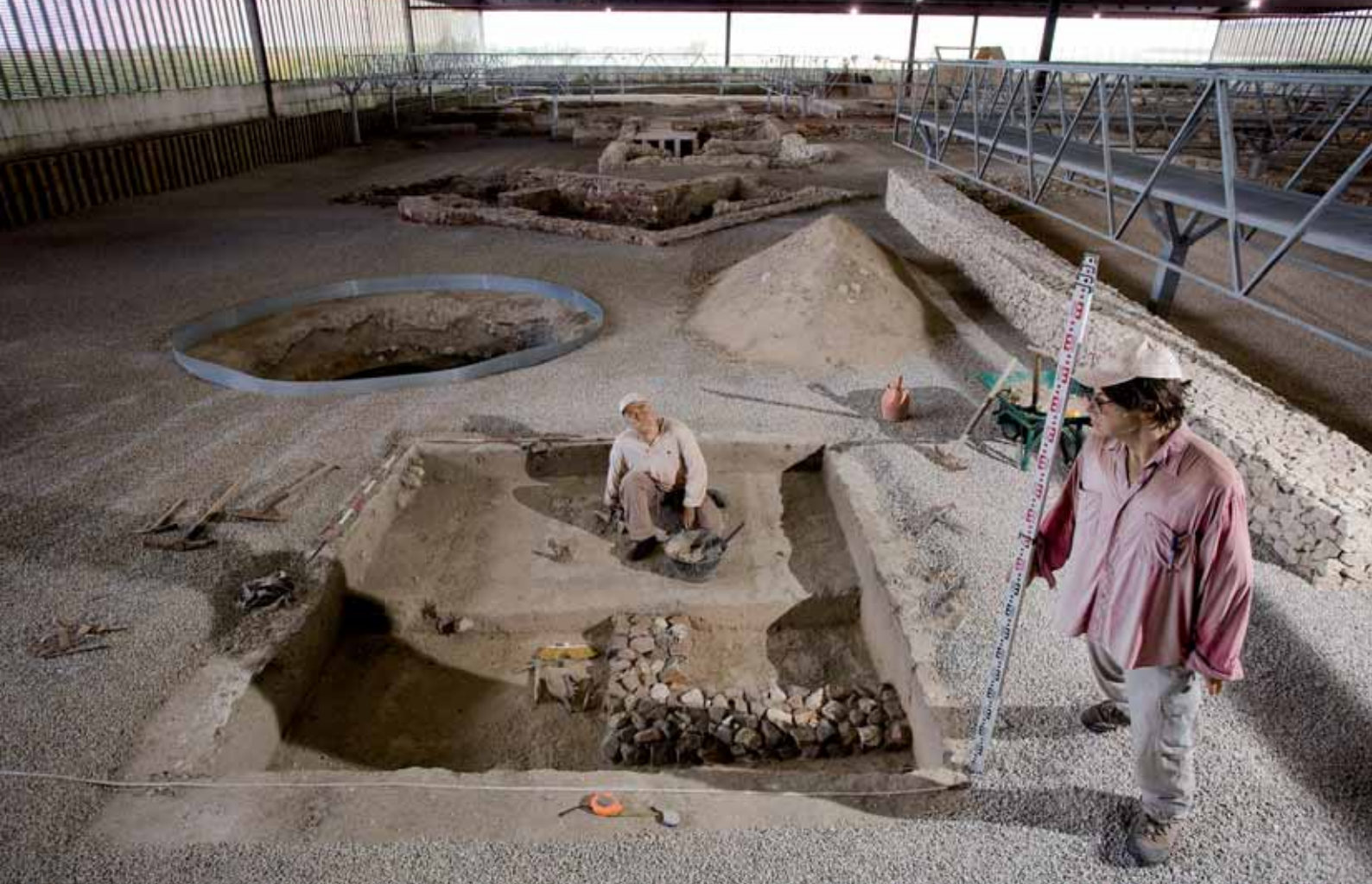
Recreación de labores arqueológicas en el Museo de las Villas Romanas de Almenara-Puras.

dicho, la visita continúa por los restos arqueológicos de la villa allí situada. El paseo se realiza sobre una pasarela elevada que ofrece una vista completa a los restos del inmueble; el itinerario muestra la distribución de los diferentes patios y habitaciones, con sus suelos de mosaico o de mortero, y parte de las pinturas originales todavía adheridas a la pared. La casa, que estuvo habitada hasta el siglo V, tiene dos patios en torno a los cuales se articulan treinta estancias,