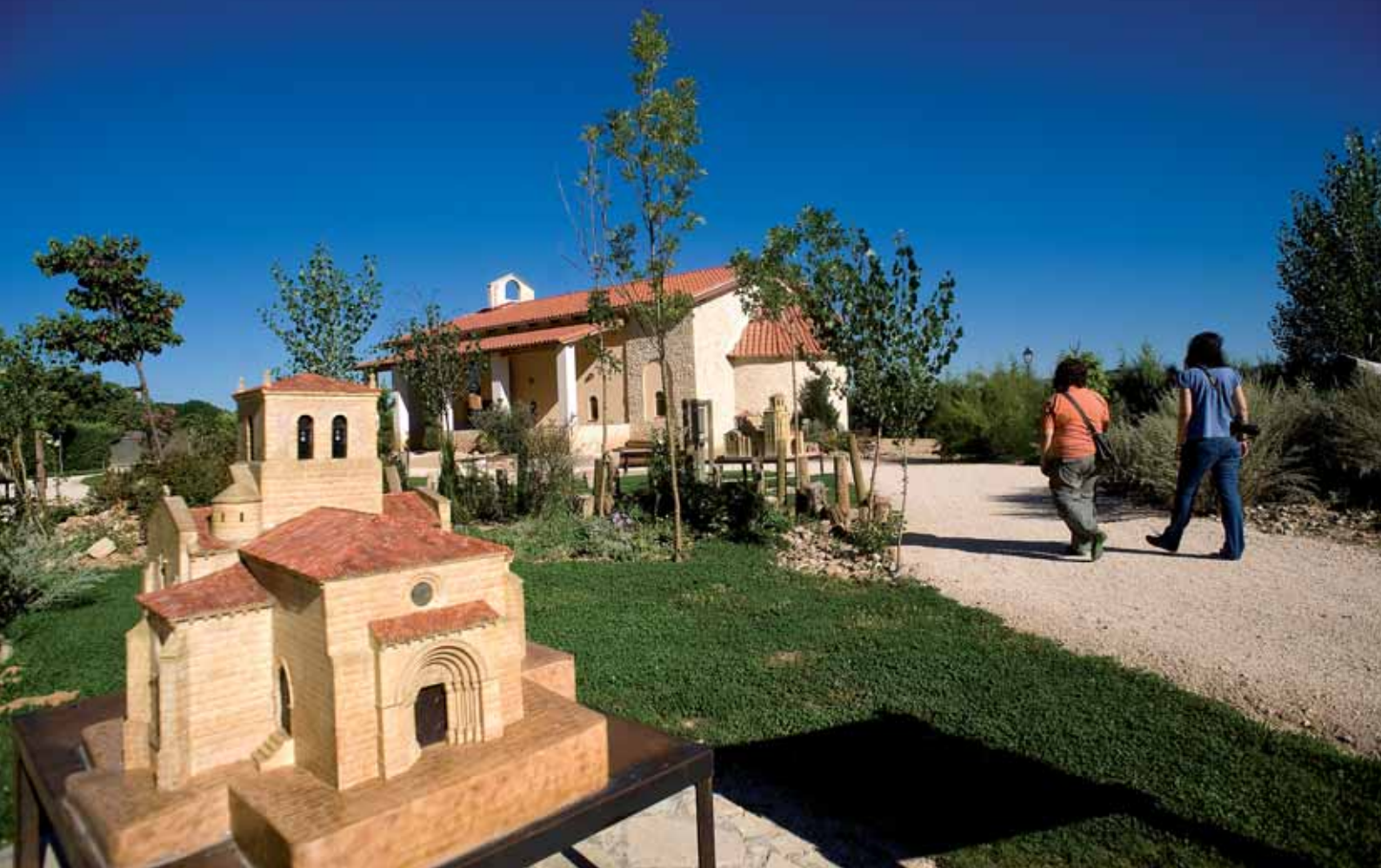
Un paseo por el Parque Temático del Mudéjar, en la villa de Olmedo.