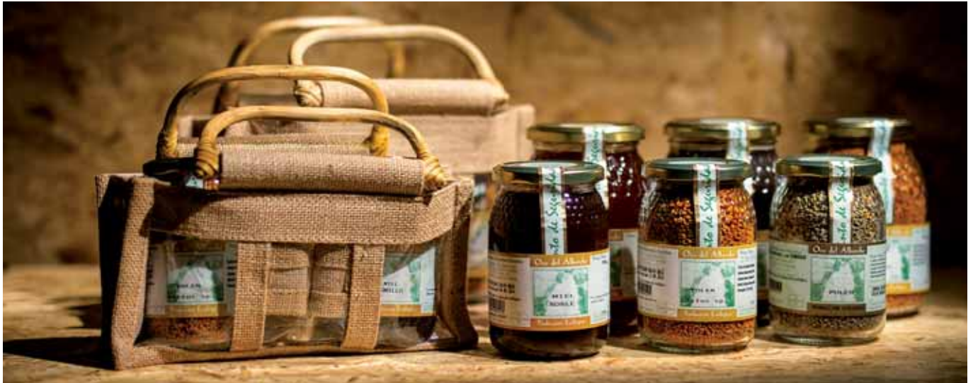
Miel de producción ecológica de Navatalgordo.

Incoara es un proyecto de cooperación que ayuda a que la comercialización directa de productos artesanos y de agroalimentación de alta calidad sea más ágil y factible