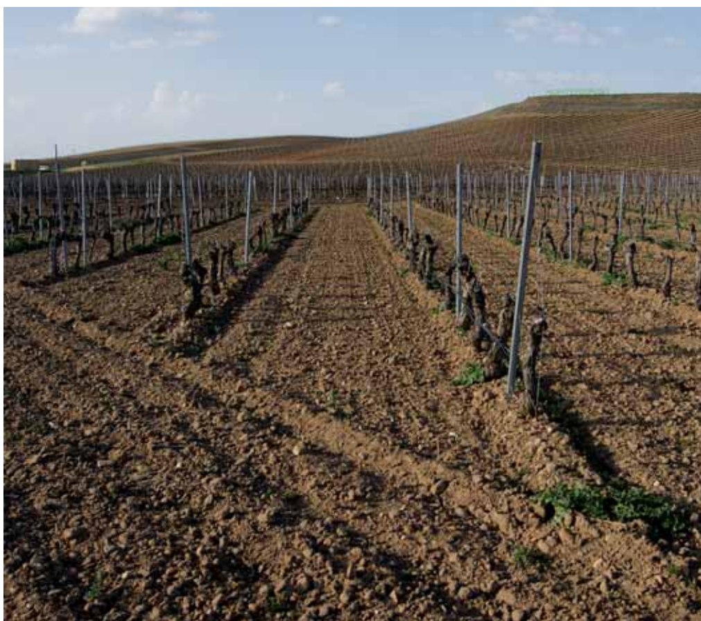
El viñedo es un recurso económico y un elemento clave en la configuración del paisaje.