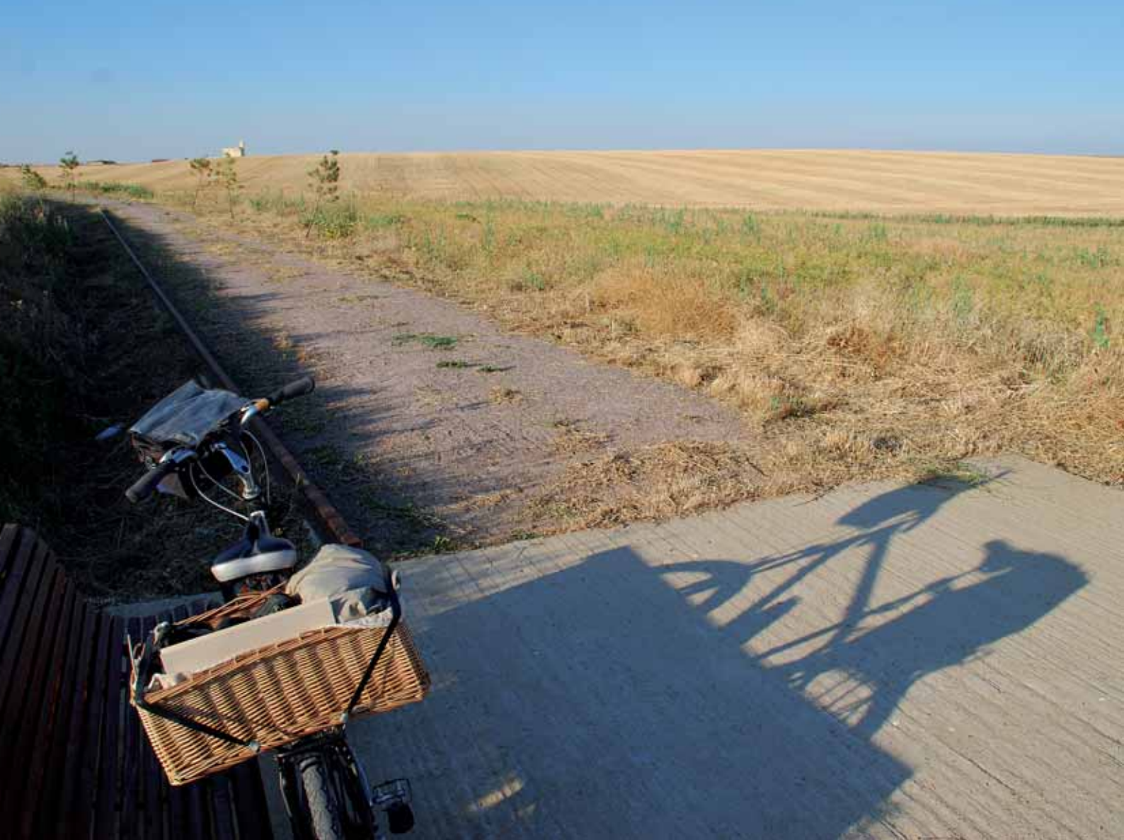
Sobre estas líneas, el horizonte inabarcable del páramo vallisoletano. En las imágenes inferiores, la Bodega Aula de Interpretación de Mucientes y el Centro de Interpretación de la Naturaleza (CIN) de Matallana.