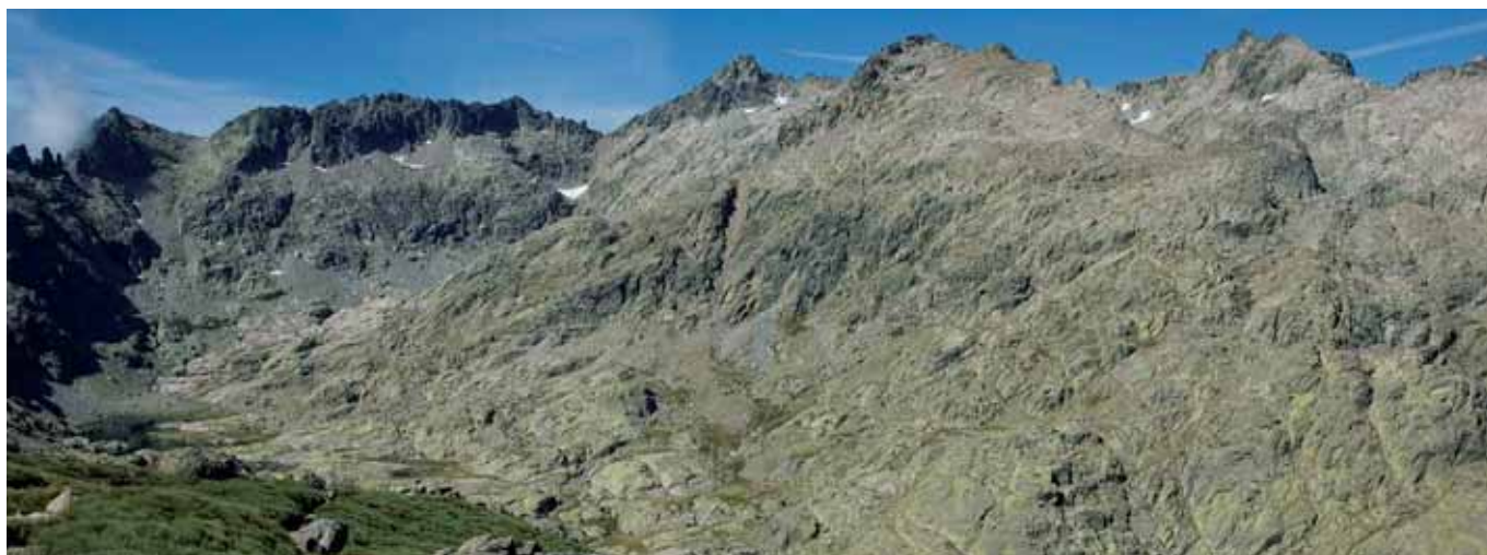
Paisaje característico de la Sierra de Gredos.

Asider ha coordinado 'Retos', un proyecto para planificar el futuro sostenible de los territorios rurales en el que han participado grupos de acción local de cuatro comunidades autónomas