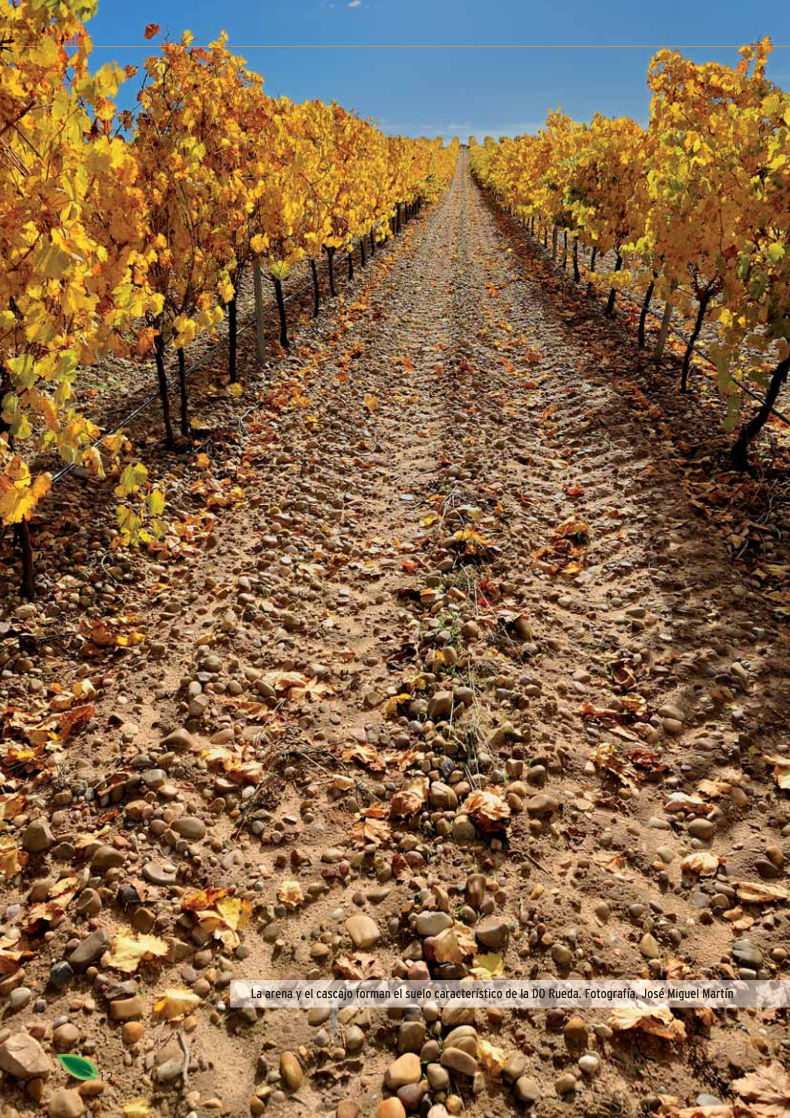
La arena y el cascajo forman el suelo característico de la DO Rueda.