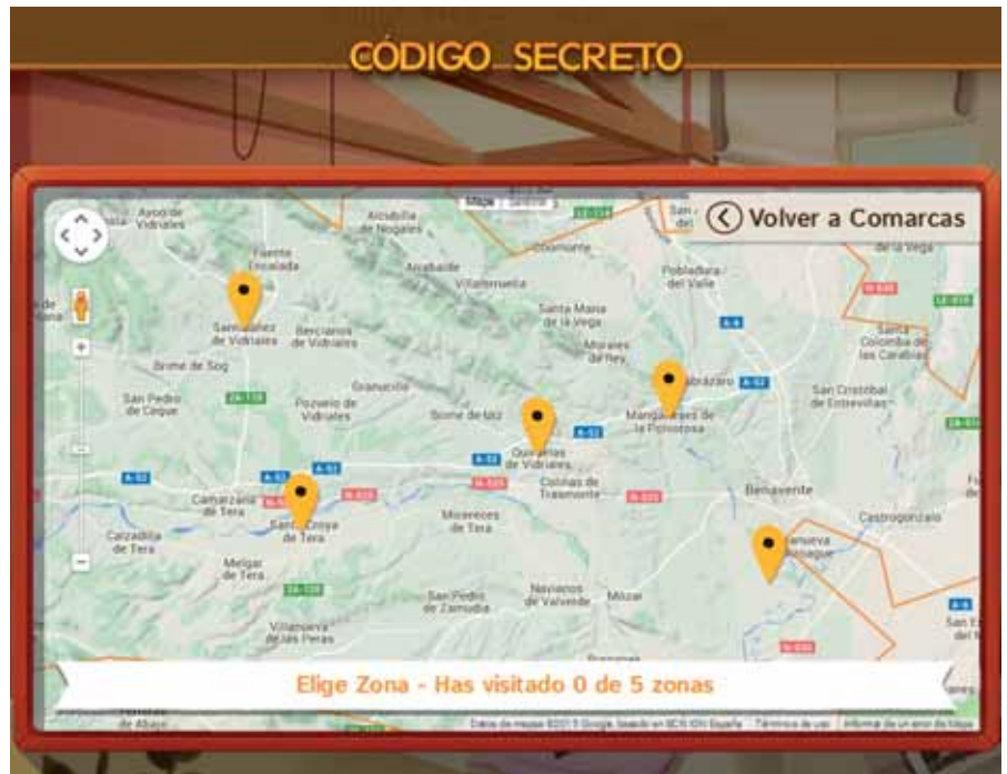
Aspecto de la aplicación ‘Geopueblos’.

La información y contenidos relacionados con la cultura, economía, sociedad y biodiversidad vinculados al