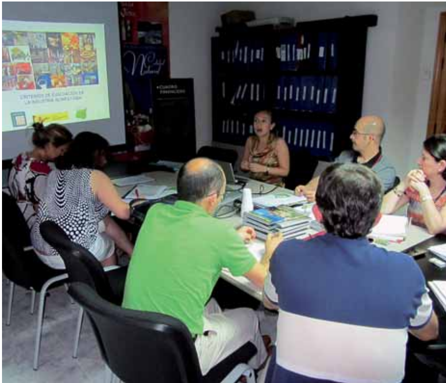
Sesión técnica del proyecto 'Calidad agroalimentaria'.

La Campiña Segoviana ha mejorado su propuesta cultural y de ocio gracias a haber destacado valores como el valle del Eresma o la vía madrileña del Camino de Santiago