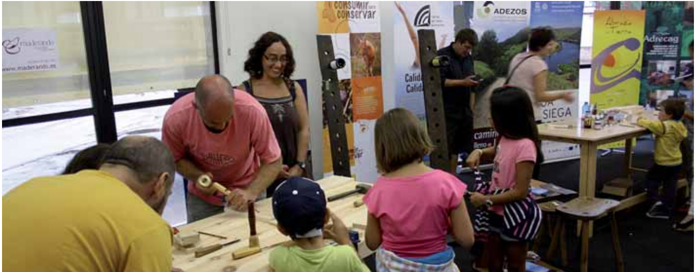
Momento de uno de los numerosos talleres celebrados con motivo del proyecto 'Olivar', en el seminario de Herguijuela de la Sierra.

'Olivar' ha promovido una estrategia de desarrollo rural territorial a partir de difundir las cualidades de variedades locales de olivo, para evitar el abandono del cultivo tradicional