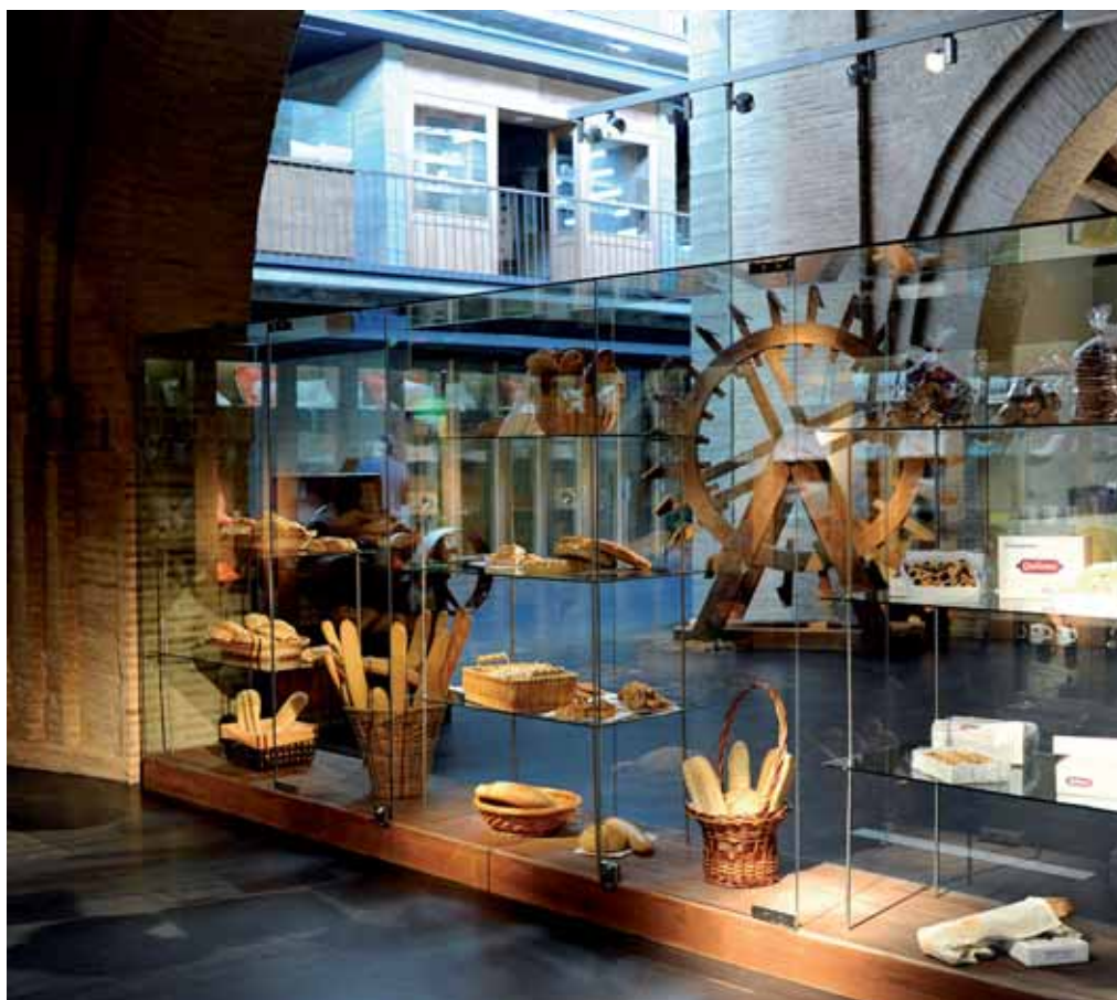
En la imagen superior, cata de vinos vallisoletanos a bordo del Antonio de Ulloa, que surca el Canal de Castilla. Sobre estas líneas, instalaciones del Museo del Pan, en Mayorga.