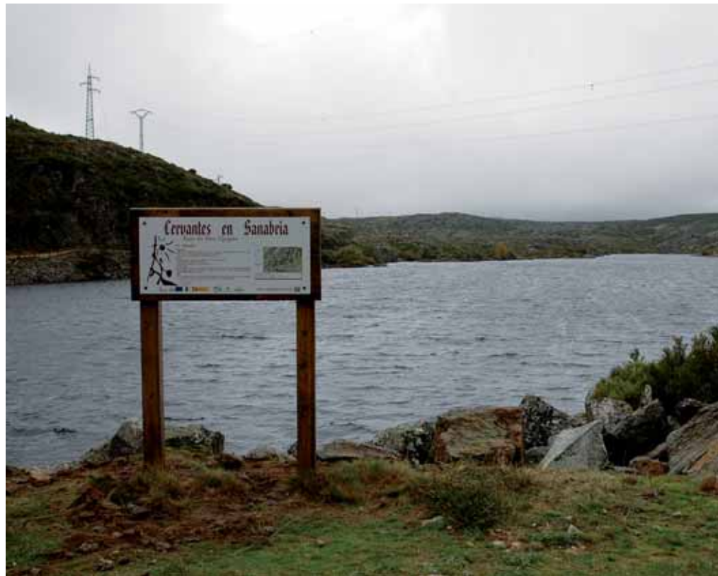
Uno de los carteles que señalizan la ruta junto al lago.

Los lugares más significativos han sido señalizados con paneles de madera, que contienen información relevante como el nombre y número del punto de interés. El número de la señal refleja el orden cronológico en el que el lugar aparece en el libro del Quijote, no el del itinerario propuesto. También incluyen citas significativas del caballero,