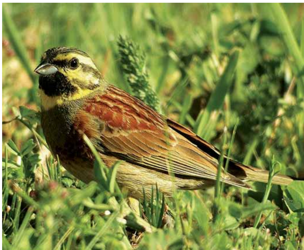
Algunos escribanos como el soteño ( Emberiza cirulus ) se pueden avistar en las rutas ornitológicas bercianas.

‘Hermes. La comunicación como vector de la imagen del medio rural’, pretende trasladar al conjunto de la sociedad una imagen del medio rural acorde con la realidad, estableciendo un espacio de comunicación abierto y