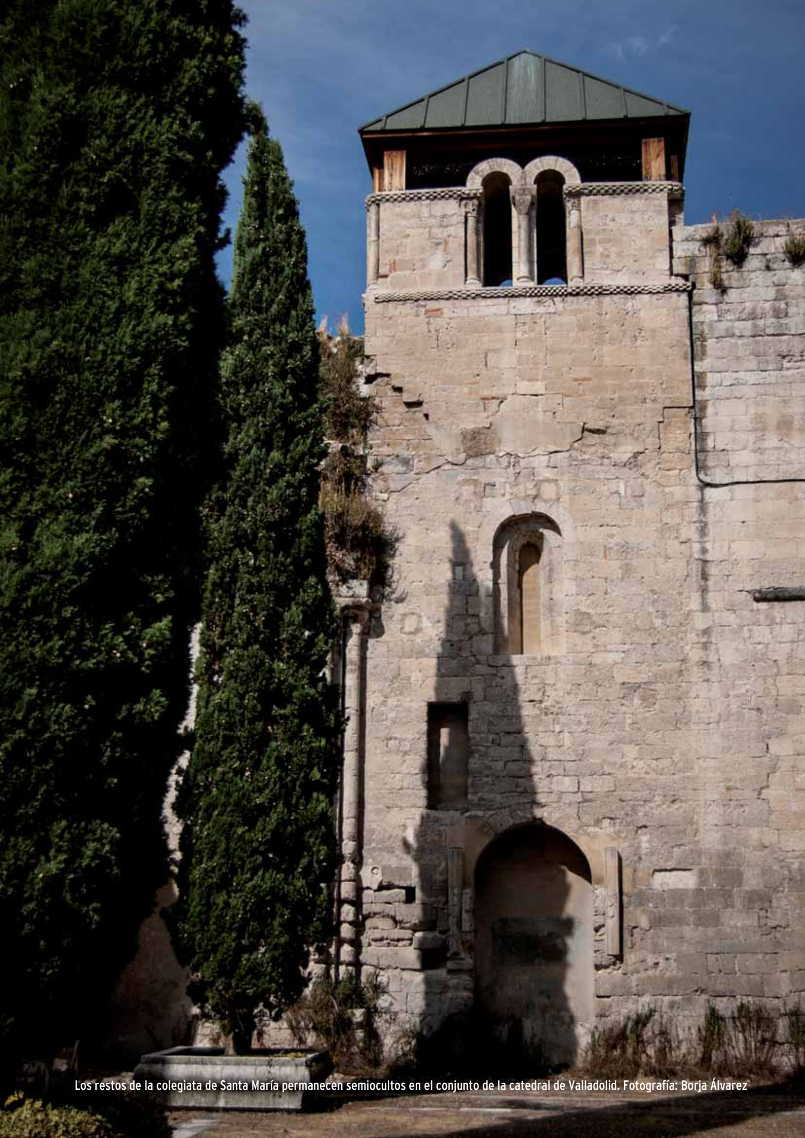
Los restos de la colegiata de Santa María permanecen semicultos en el conjunto de la catedral de Valladolid.