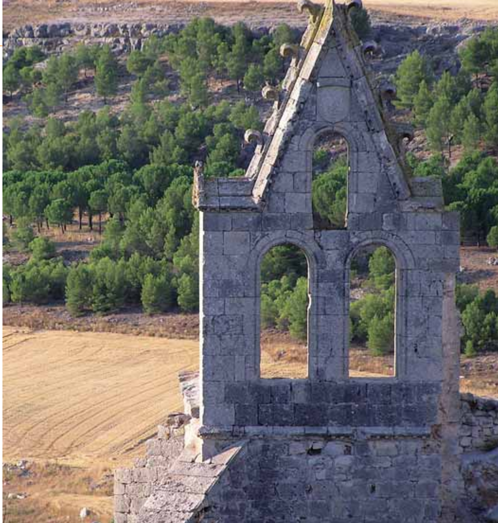
Espadaña de Santa María de la Armedilla, en Cogeces del Monte.

En Castilla y León esta iniciativa ha ido aumentando su presencia con el paso del tiempo hasta llegar a los 44 grupos de acción local que operan en la actualidad en el 97% del territorio. Esto supone que, en 20 años, se ha multiplicado por más de cinco el número de grupos y se ha incrementado el territorio beneficiado por este tipo de actuaciones en 83 puntos porcentuales. Los 44 grupos actuales han ejecutado, en el marco del PDR anterior, un total de 4.000 proyectos de desarrollo rural, con un gasto público de 108 millones.