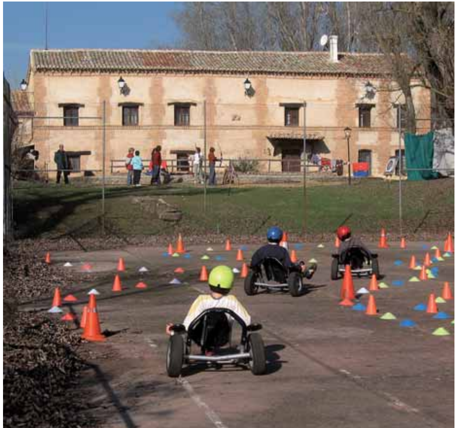
Balanz Bike en Belver de los Montes.

En las actividades participaron 1.329 personas, la mayoría de otras provincias de Castilla y León, y también de Madrid. Mediante este proyecto se trató de dar a conocer los recursos turísticos que ofrecen estos territorios, haciendo más atractiva la estancia a los visitantes.