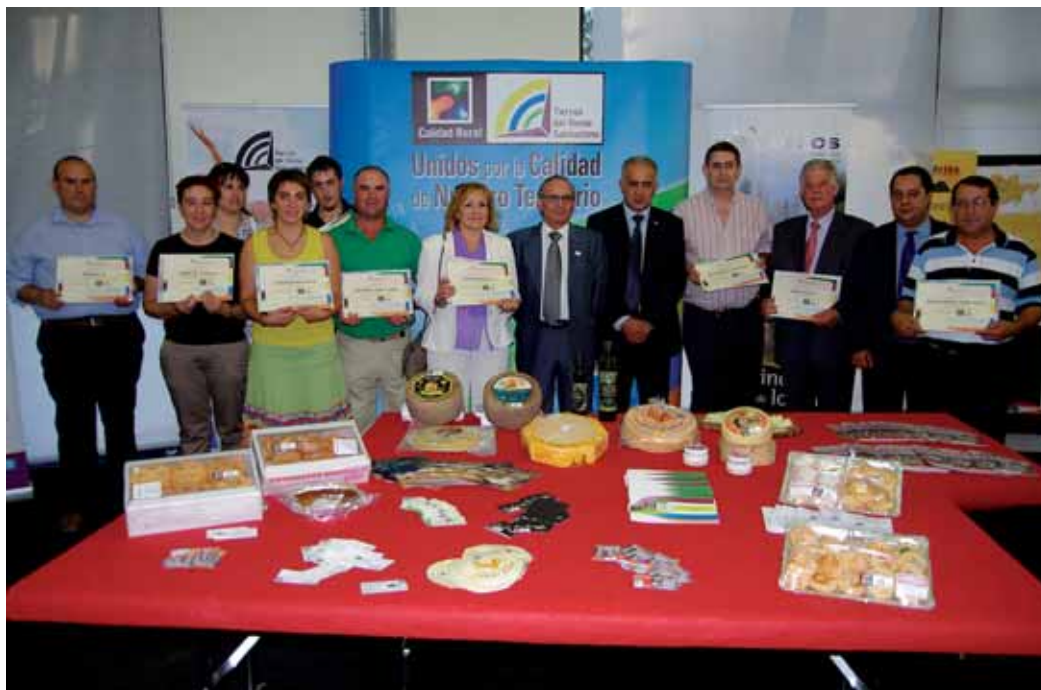
La iniciativa acredita los productos y servicios adheridos.

'Tierras del oeste salmantino. Calidad rural' pone en marcha una estrategia de desarrollo rural con enfoque territorial integrado y sostenible, fundamentado en una calidad integral