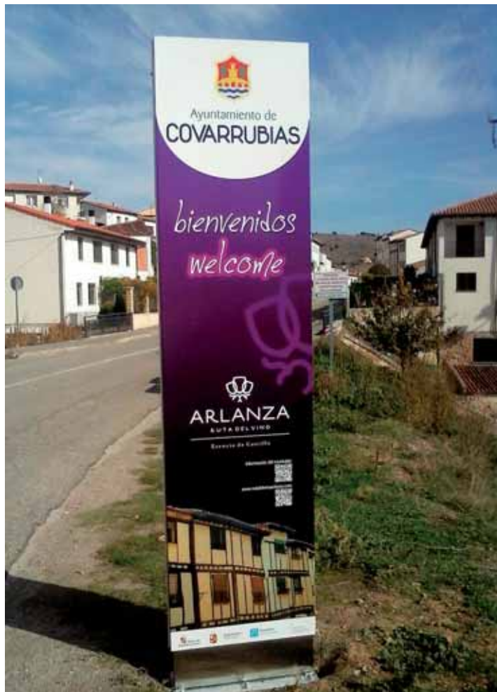
Señalización de la Ruta del Vino en Covarrubias.

En este último periodo, junto con proyectos como el multitudinario Trino o el mediático Hermes, la asociación ha participado en dos iniciativas de diversa complejidad y objetivos. Como territorio con municipios integrados en la denominación de origen del Vino del Arlanza, Agalsa ha participado la creación de la 'Ruta del Vino Arlanza', reconocida y homologada por Acevin (Asociación Espa-