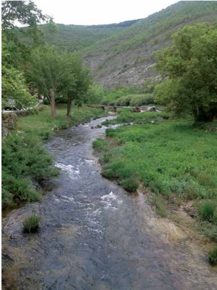
Las aguas del alto Rudrón están pobladas por hermosas truchas.

‘Ninfa Calidad’ es un proyecto de cooperación interterritorial desde el cual se pretende convertir el deporte de la pesca en un recurso turístico y de desarrollo rural basado en la sostenibilidad y el respeto por el medio rural. Con la participación de nueve grupos de acción local, se ha formado a un nutrido grupo de pescadores ribereños como guías de pesca, que han adquirido los conocimientos necesarios para acompañar y orientar a los turistas pescadores sobre las mejores zonas, señuelos y momentos de este arte.