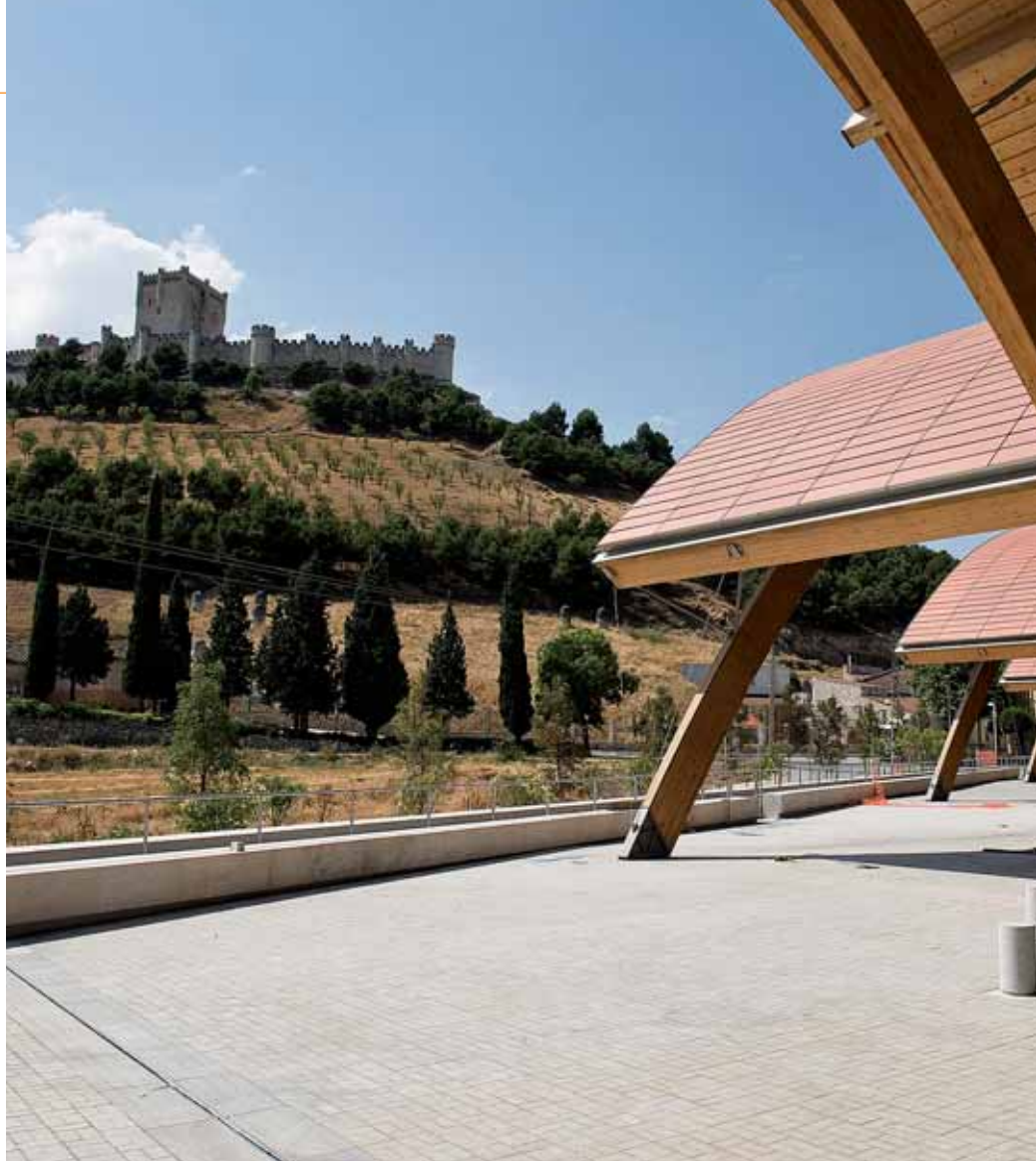
El Museo Provincial del Vino visto desde las instalaciones de Bodegas Protos, en Peñafiel.

vierten en poderosos focos de atracción lechazo, morcilla, queso, sopa y legumbre, además del afamado Pan de Valladolid, amparado por una marca de garantía.