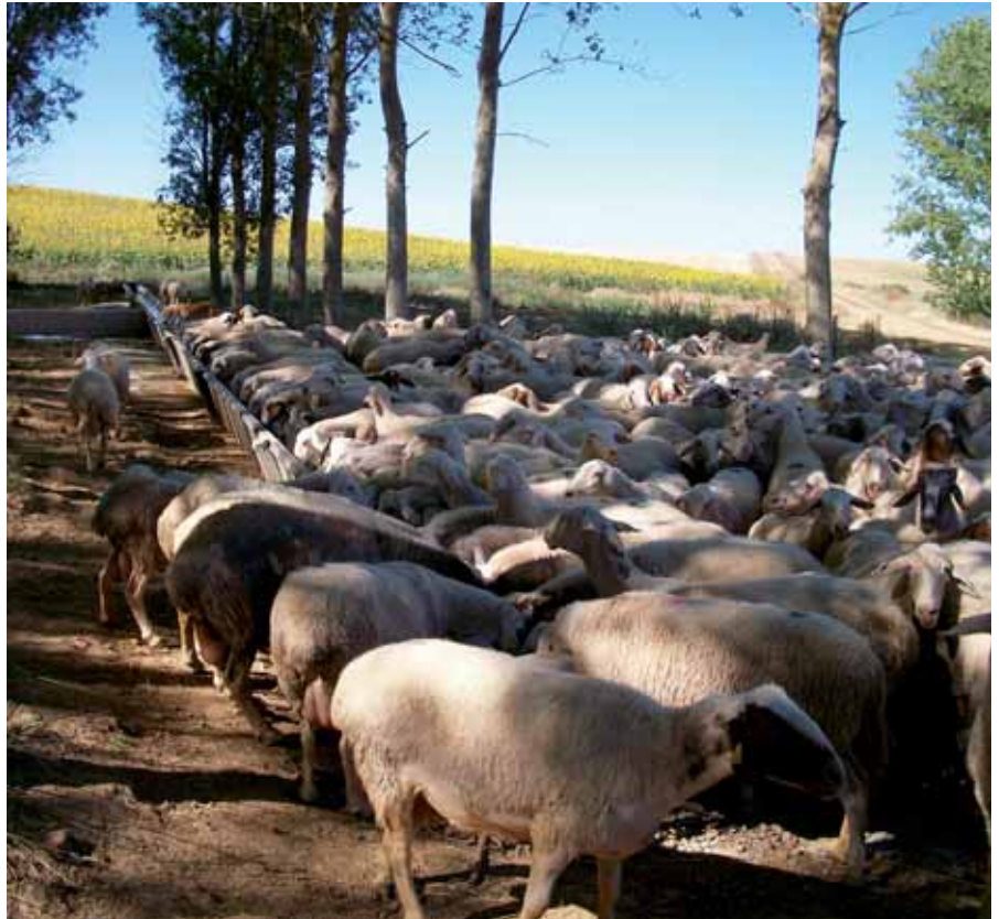
Los rebaños de ovejas forman parte del paisaje de este territorio.

'WOLF' ha sido un proyecto de la Red Rural Nacional ha permitido trabajar con 16 GAL de Estonia, Portugal, Rumanía y España, e impulsado el papel de la ganadería y de los ganaderos como elementos clave de un desarrollo sostenible de los territorios rurales. Este proyecto ha divulgado medidas de compatibilidad y coexistencia entre los grandes carnívoros y la ganadería; y ha buscado entre los agentes implicados (ganaderos, cazadores, ayuntamientos, empresarios, etc) distintos aprovecha-