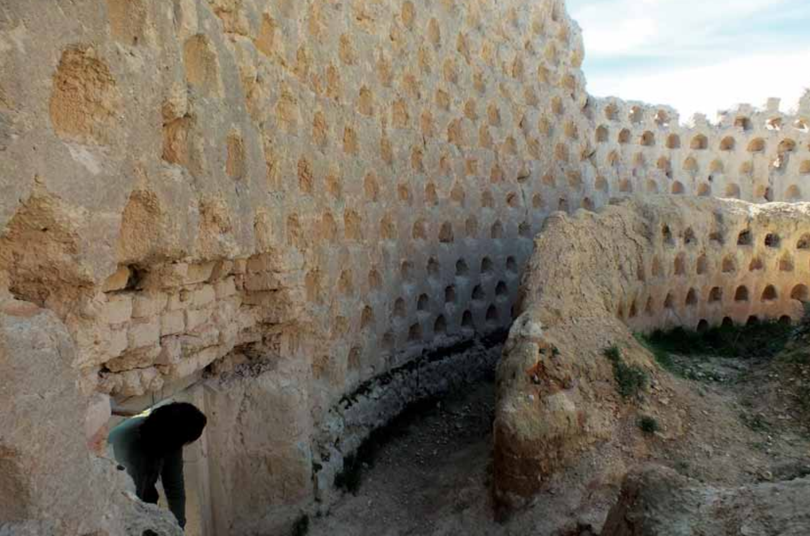
Restos de un palomar, ejemplo único de la arquitectura popular de Tierra de Campos.

sonas expertas o de curiosos, que han hecho del libro y los sectores en él implicados una manera de vivir.