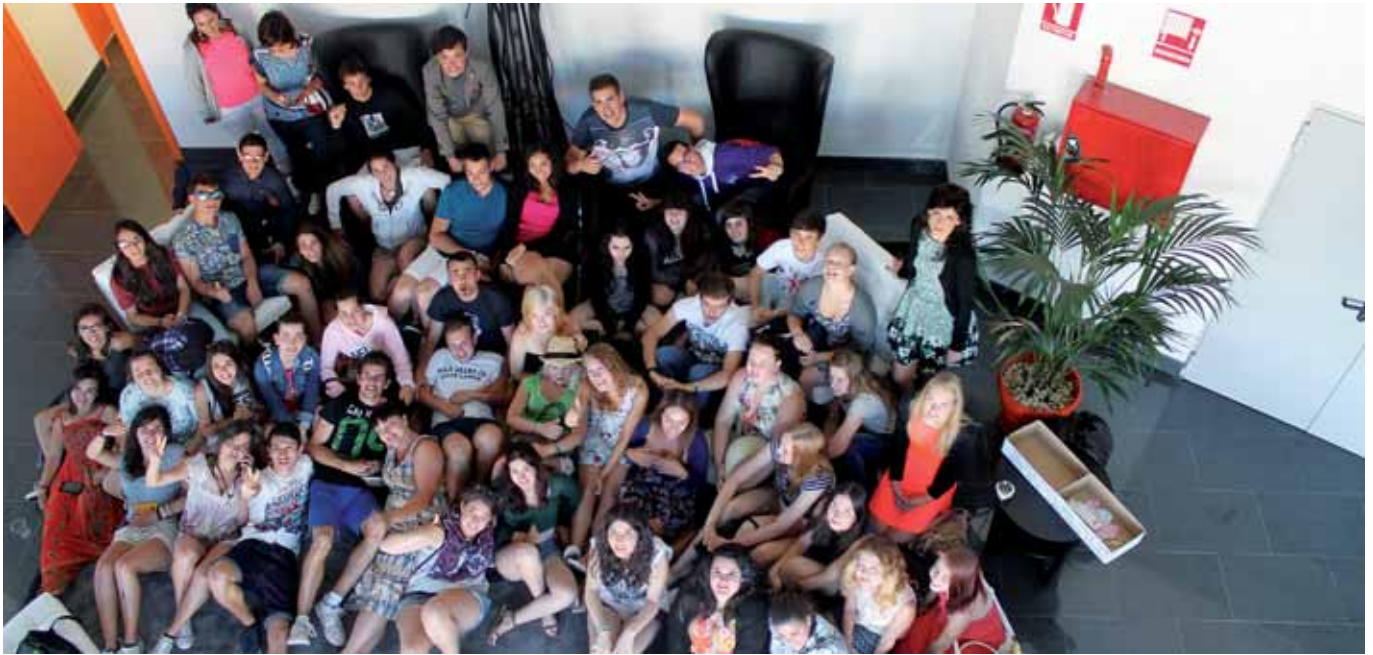
Participantes en el proyecto internacional Jóvenes Rurales.

La relación entre los mundos rural y urbano, el turismo ornitológico y el emprendimiento social juvenil, apuestas para el futuro de la comarca del Nordeste de Salamanca