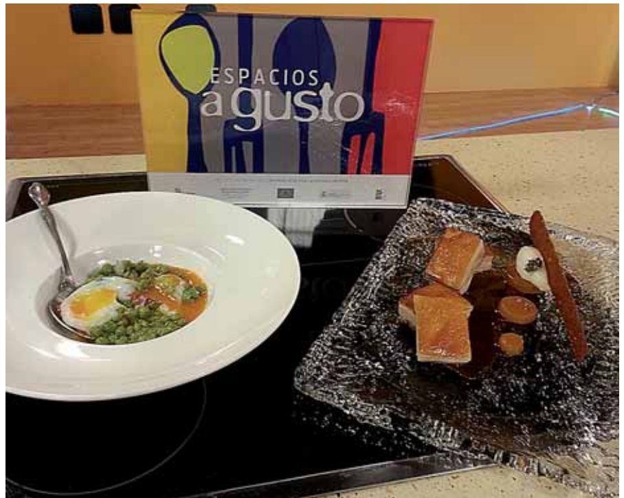
Algunas de las elaboraciones que ya se han podido ver en televisión.

Muchos turistas, procedentes en buena parte de Madrid, escogen Casti-