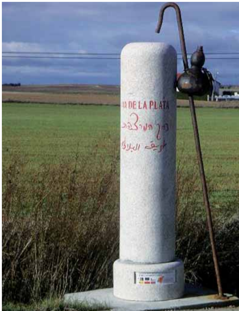
Señalización renovada en el Camino de Santiago.

Apostando por la mejora de la calidad de los productos de las empresas agroalimentarias de nuestras comarcas iniciamos la puesta en práctica de la iniciativa denominada ‘Calidad agroalimentaria, señas de identidad de los ter-