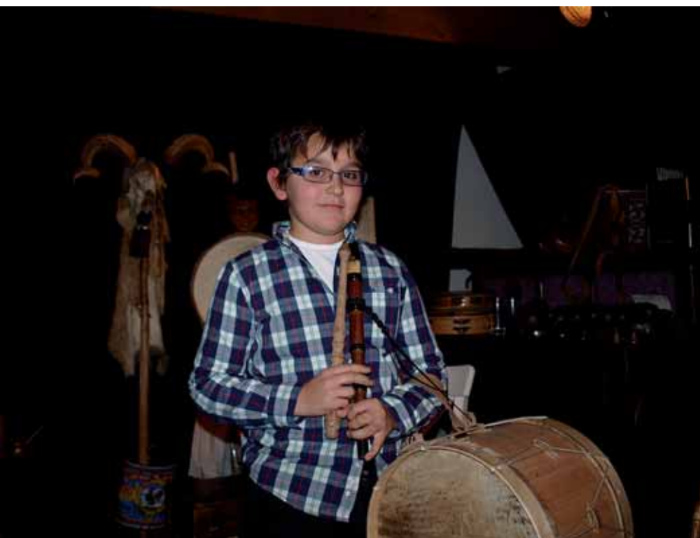
Ganador del Certamen de Música Tradicional, en el marco del proyecto ‘Interritmos’.

‘Interritmos: ritmos y pueblos’ ha incidido en la caracterización, visibilización, recuperación, puesta en valor y difusión del valioso patrimonio musical de los espacios rurales