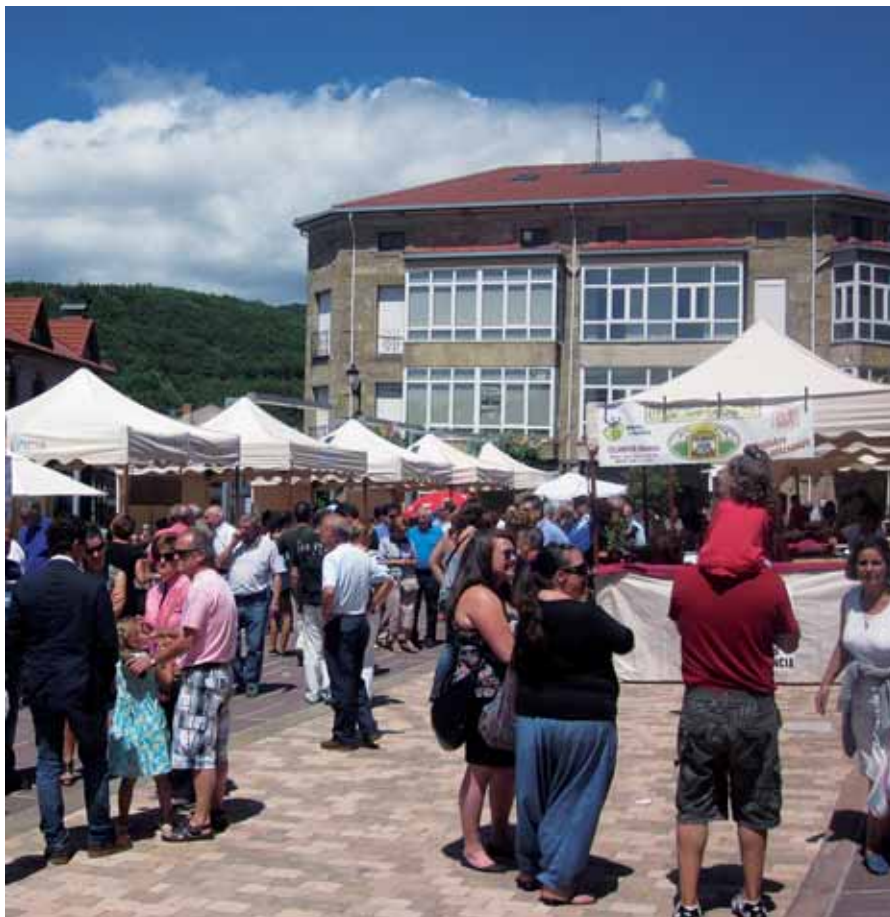
El programa apostaba por transmitir los conocimientos a las generaciones actuales.

El proyecto nació con el objetivo de recopilar ese patrimonio comarcal, transmitido de generación en generación. Para ello debió realizarse una ambiciosa campaña de localización de los poseedores de ese conocimiento. Una vez recopilado ese saber, se procedía a formar a la gente joven local, con intención de alimentar la transmisión de esos conocimientos y, de esta manera, evitar su pérdida. Es importante destacar que todo ese proceso de