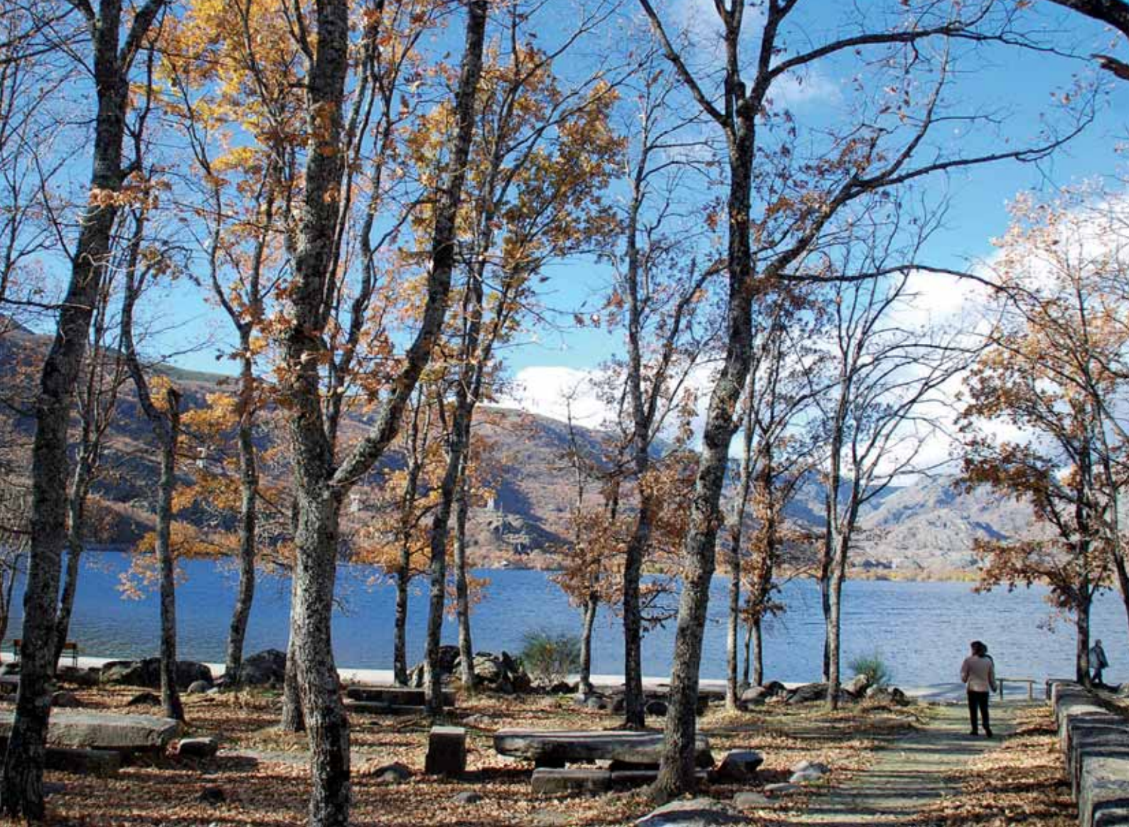
Estampa invernal del Lago de Sanabria, el mayor de origen glaciar de España.

palomares, molinos, cercas y vallados de piedra, puentes... un enorme patrimonio poco a poco rehabilitado y vinculado estrechamente al medio físico en el que se ubica.