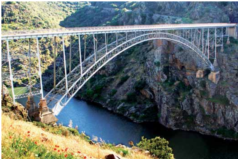
El Puente Pino, sobre el río Duero.