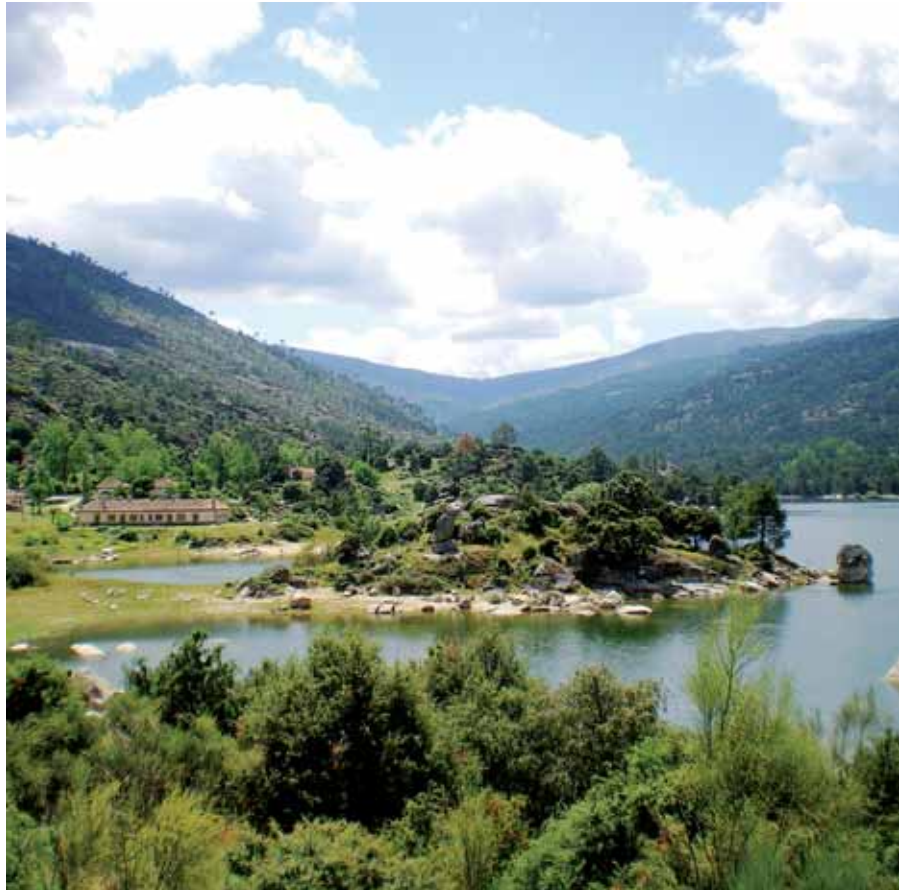
Núcleo de turismo rural Valle de Iruelas.

Por las características del territorio, la ganadería es el sector principal de actividad agraria. Es una ganadería de carácter extensivo y de gran calidad, con un exponente muy conocido en la IGP Carne de Ávila. Las nuevas incorporaciones de jóvenes agricultores y ganaderos, si no se trata finalmente de