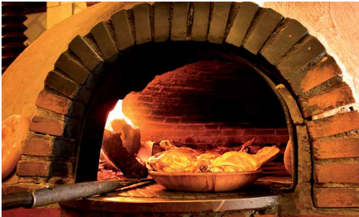
La carne de la IGP Lechazo de Castilla y León es uno de los productos emblemáticos que se comercializan bajo el paraguas de Tierra de Sabor.