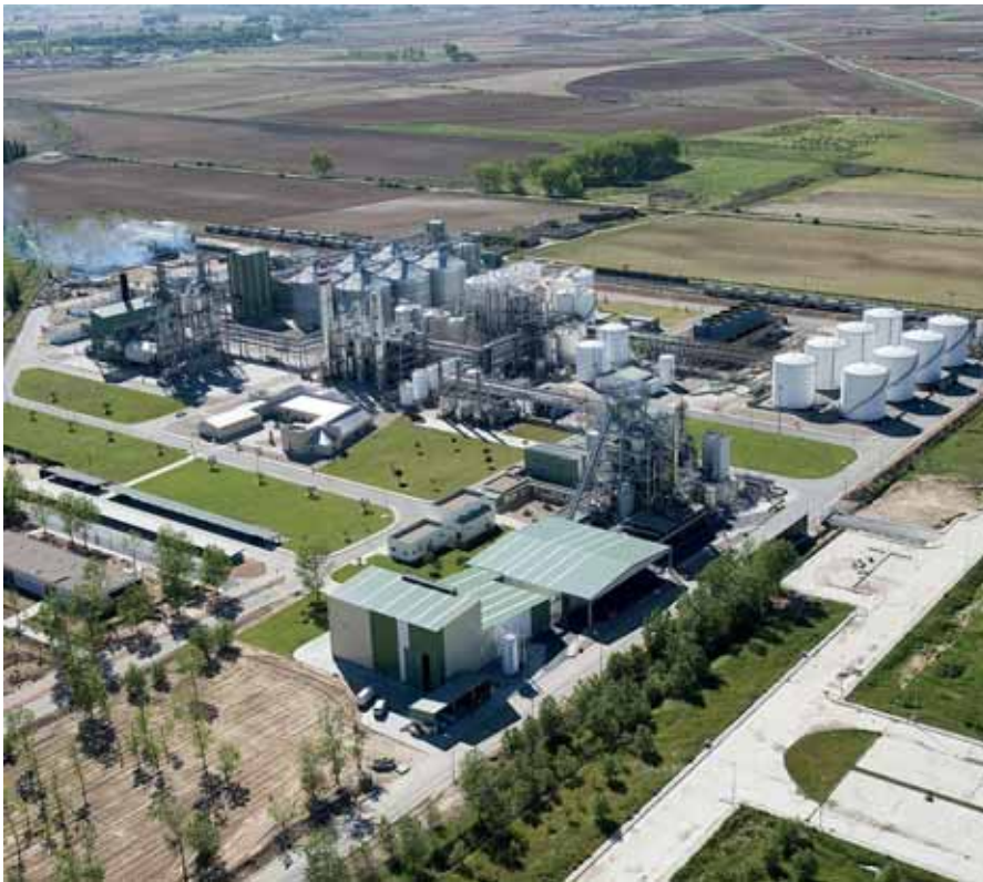
Planta de bioetanol de Babilafuente.

Las marcas de calidad dan el valor añadido a los reconocidos productos de la zona. El sector terciario es el que más crece, con mejor equilibrio entre el empleo masculino y femenino