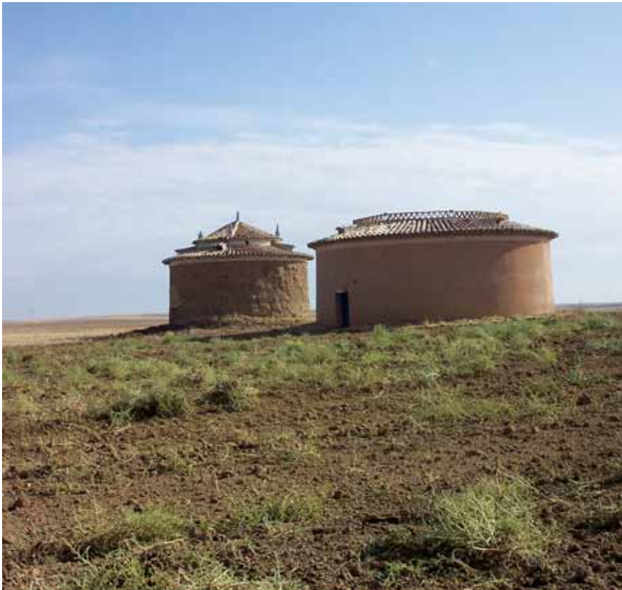
Los palomares componen una imagen característica del territorio.

Dotar de valor añadido a los reconocidos quesos, lentejas, pichones y vinos, además de una mayor promoción del patrimonio, son los pilares del futuro desarrollo de la Tierra de Campos vallisoletana