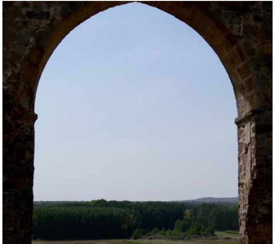
Vista del valle del Éria, desde la fortaleza hispanoárabe de Castrocalbón.

Los sectores alternativos y complementarios a la agricultura -servicios e industria- son las actividades más necesarias y dinámicas para incentivar el crecimiento de la economía y propiciar la materialización de iniciativas de acompañamiento (mejoras medioambientales, agroindustria, artesanía y actividades turísticas), que permitan mantener unos niveles de producción