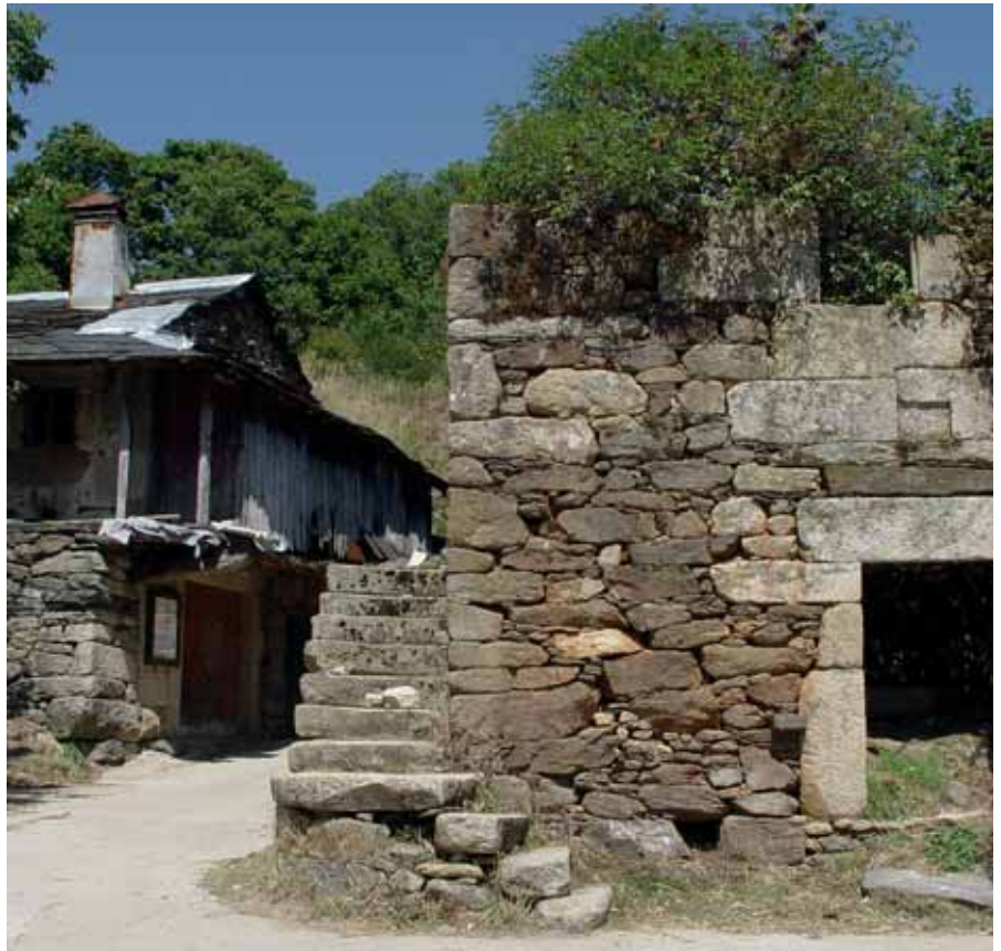
Calle en la localidad de Las Hedradas.

En la revalorización de lo rural tiene este territorio su gran oportunidad. El desarrollo del sector turístico, y de ocio, aprovechando la riqueza en patrimonio