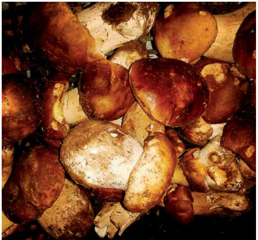
La comarca es reconocida por la calidad de sus productos micológicos.

Por lo que se refiere al capital humano, hay una excelente oportunidad para incentivar el empleo y el emprendizaje a través de la puesta en marcha de talleres y proyectos infantiles para aprender a innovar y emprender, además de mediante el impulso de cooperativas y asociaciones. El capital humano es, en esencia, el gran valor de la Demanda.