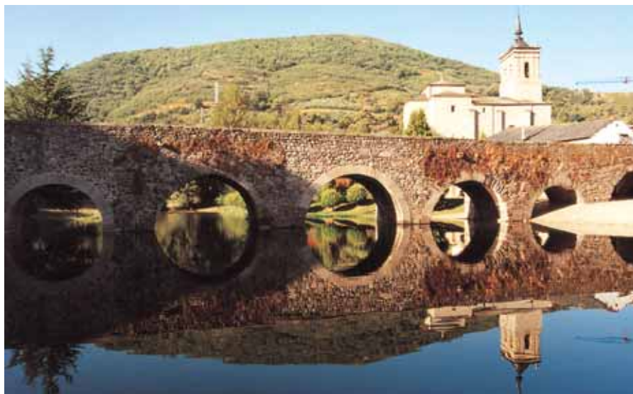
Puente romano de Molinaseca, en el Camino francés a Santiago de Compostela.

Además el territorio ha alcanzado un alto grado de especialización alimentaria, con un elevado nivel de productividad de las empresas del sector, muy por encima de la media nacional y con una evolución positiva de las cifras de ventas, que incluye una tendencia creciente de las exportaciones. Seis son las marcas de calidad reconocidas por la Administra-