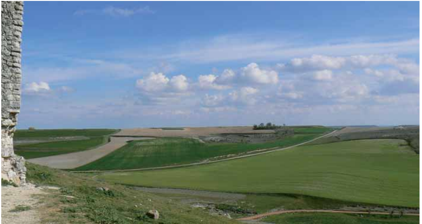
Paisaje característico, modelado a partir de la actividad agraria dominante en el territorio.

Las localidades del centro de Valladolid disponen de una densidad de población adecuada, y equilibrada entre hombres y mujeres, para acometer actividades que dinamicen la comarca