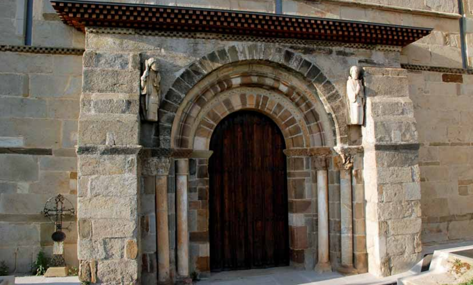
A la izquierda, los carochos de Riofrío de Aliste. Sobre estas líneas, iglesia de Santa Marta de Tera, en pleno Camino Sanabrés.

Duero y Douro Internacional) localizados en Zamora, Salamanca y Portugal.