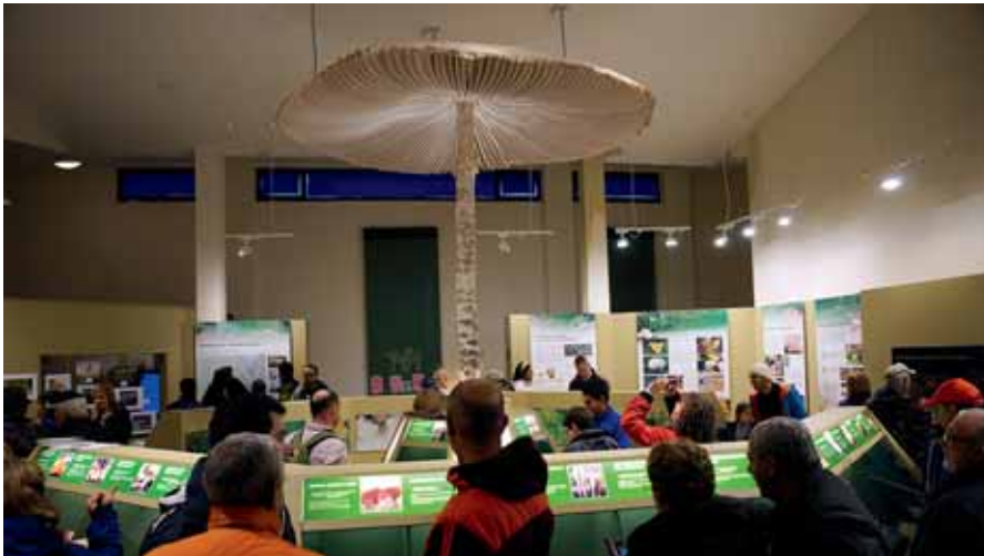
Jornada en el Centro de las Especies Micológicas de Rabanales de Aliste.

Las elaboraciones y la comercialización a partir de productos naturales de gran calidad como hongos, castañas, moras y las buenas carnes locales impulsan una pujante industria