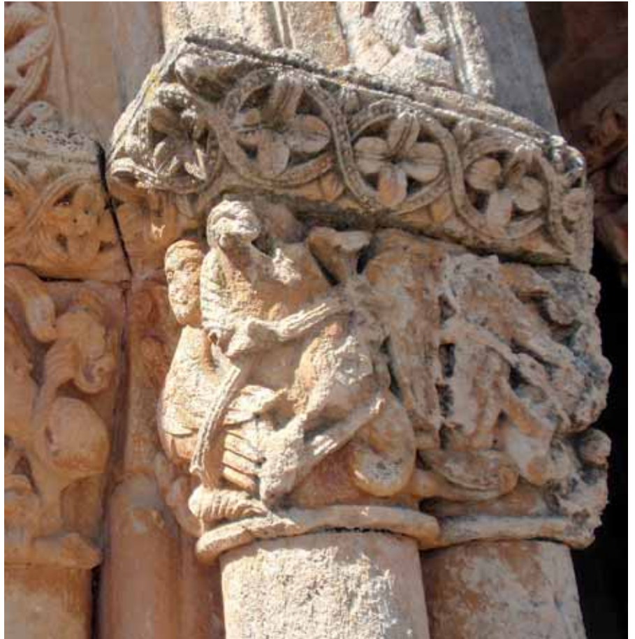
Capitel románico en Rebolledo.

En este ámbito del turismo, el territorio posee valores significativos. Es el caso de excelentes piezas de arte románico, yacimientos arqueológicos, una