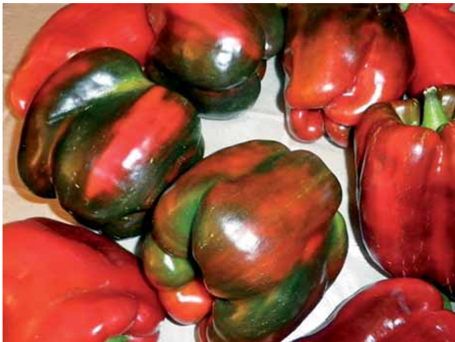
Pimientos de Benavente.

La importancia del campo se traduce en datos como que las actividades agroalimentarias representan más del 60% de las industrias manufactureras, de las que destacan la del pan y la bollería. Las em-