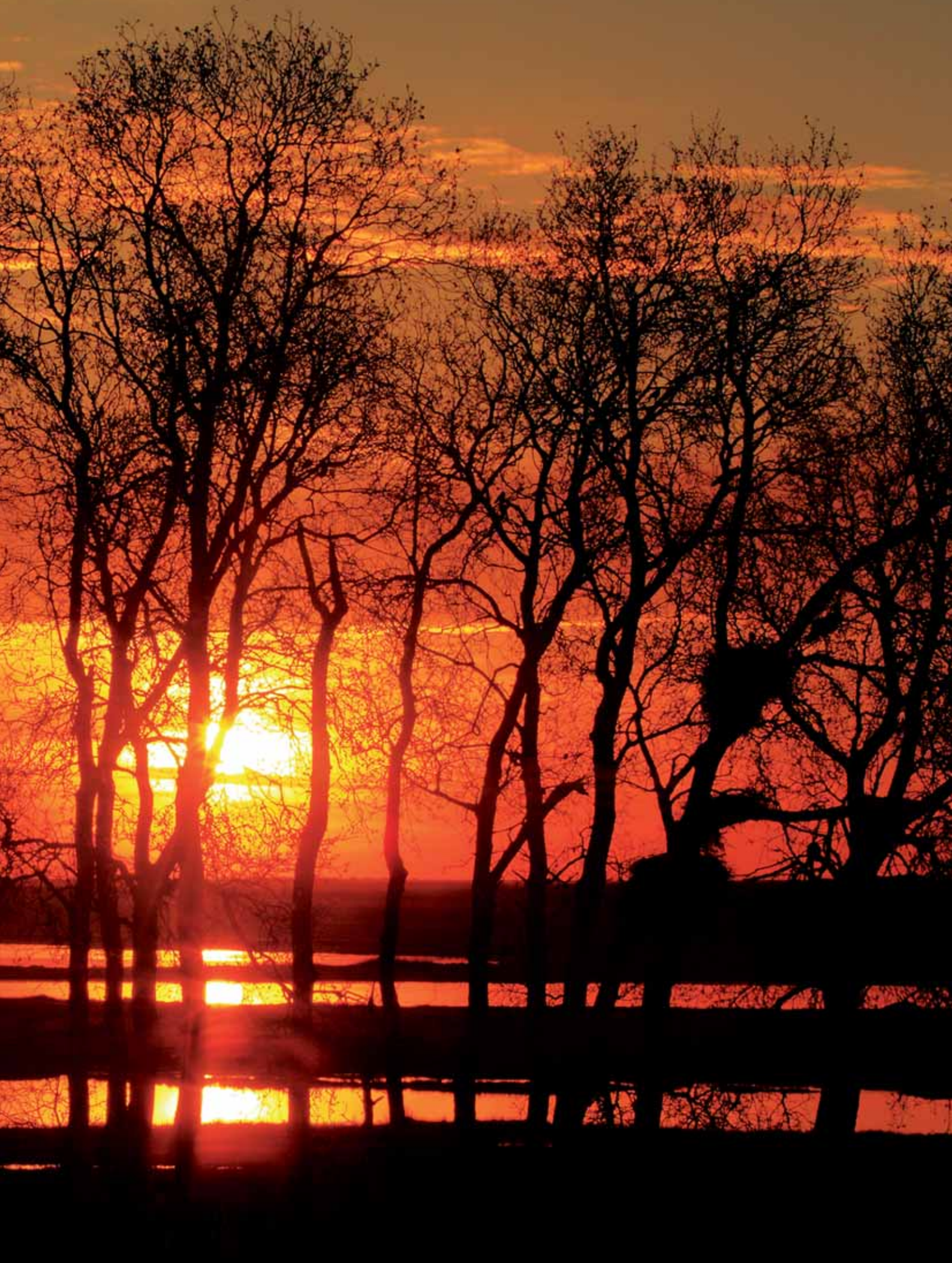
Puesta de sol en la lagunas de Villafáfila.