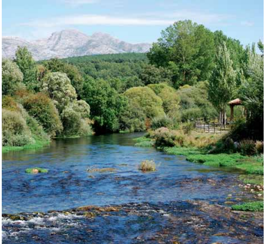
Varios ríos de gran valor ecológico discurren por la comarca palentina.

La excesiva dependencia de la agricultura y ganadería de monopolios externos, las importaciones a nivel nacional que generan elevada competencia con las producciones y reducen la rentabilidad de las empresas locales, la salida de materias primas desde el interior de la comarca al exterior sin transformación previa, el elevado posicionamiento de empresas externas en el aprovechamiento de los recursos comarcales, la alta dependencia externa en el suministro de inputs -estratégicos para el funcionamiento de la