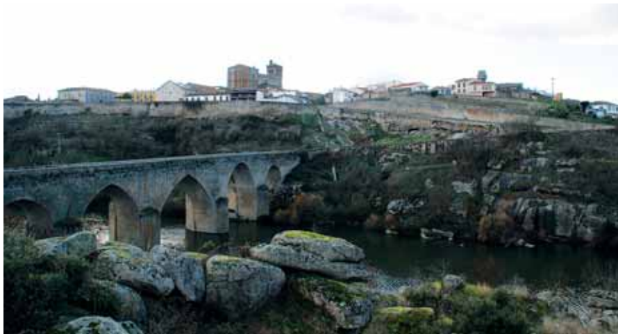
Panorámica de Ledesma.

Una de las oportunidades para el crecimiento económico de la comarca reside en su ubicación, puesto que el territorio limita con Zamora por el norte y con Portugal por el oeste. El territorio fronterizo lo define el río Duero, que ayer separaba y hoy enlaza este territorio con el país luso; la participación entre los habitantes de ambos territorios es efectiva y dota a la zona de un carácter