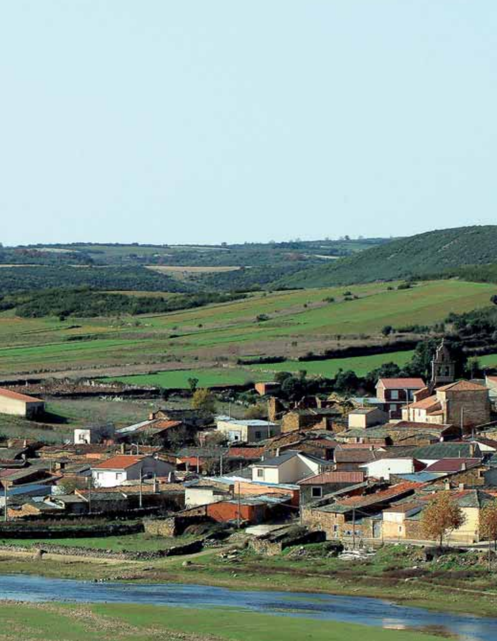
El río Aliste, a su paso por la localidad de Vegalatrave.