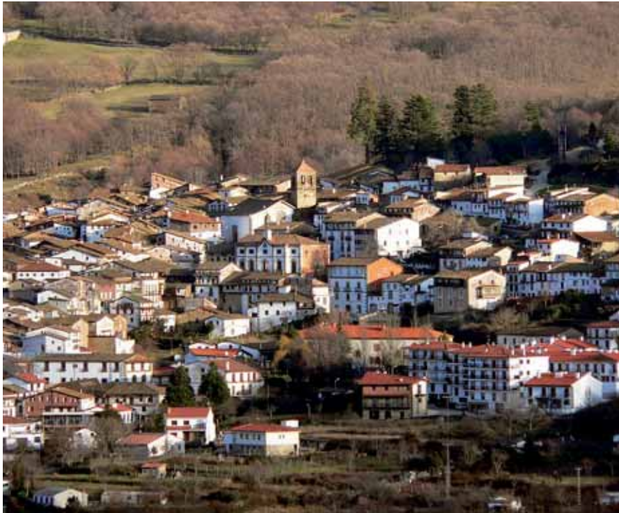
Vista general de Candelario, en la Sierra de Béjar.

Las Sierras de Béjar y Francia se enfrentan a los retos de incrementar el número de activos agrarios y profesionalizar a los emprendedores de los sectores estratégicos