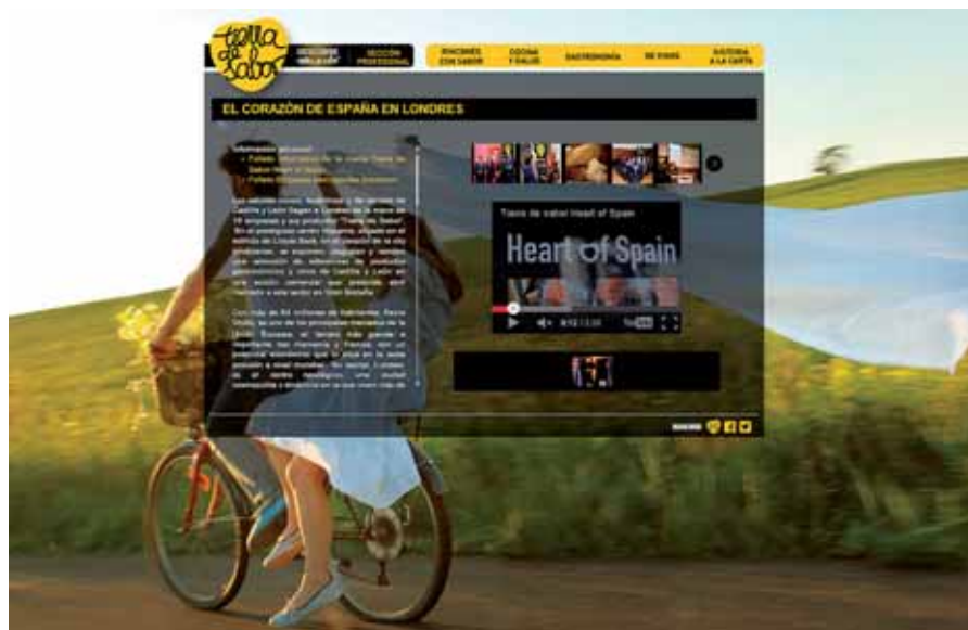
El boletín incluye información de utilidad para los empresarios del sector.

La publicación, con una periodicidad trimestral y que se remite a las 851 empresas adheridas, incluye información de las acciones de promoción programadas y realizadas