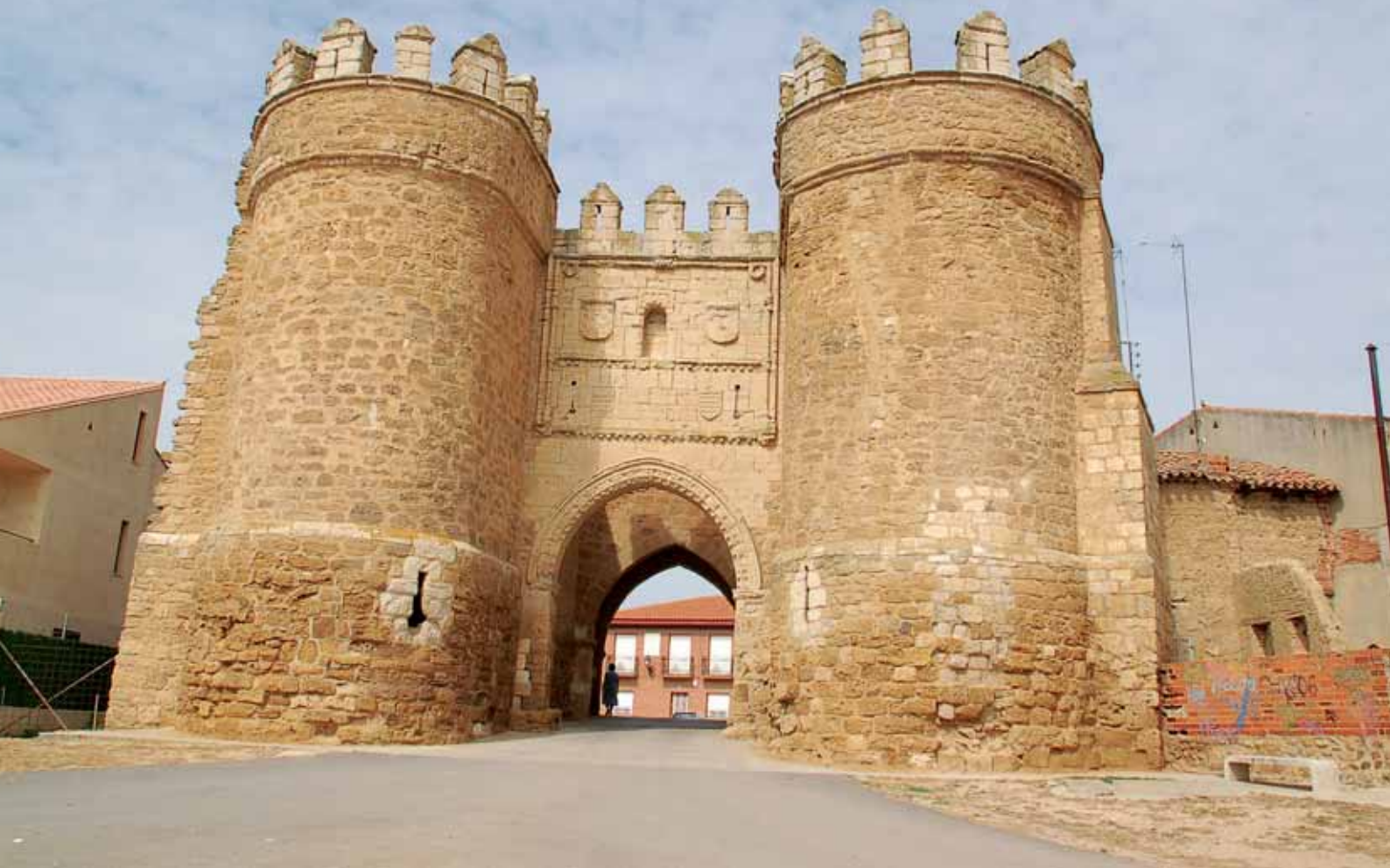
Puerta de San Andrés, en la Tierra de Campos zamorana.

La geografía zamorana está salpicada por ríos, lagos y lagunas de extraordinaria importancia, habitadas por especies animales y vegetales casi únicas gracias a una posición estratégica, que la sitúa entre los climas atlántico y mediterráneo. No es por ello casualidad que el patrimonio agroalimentario sea uno de los puntos fuertes de la provincia desde el punto de vista económico, pero también turístico.