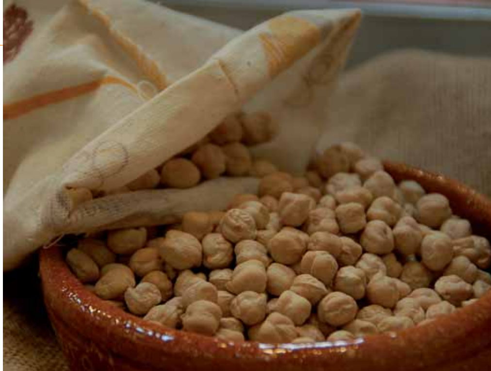
A la izquierda, el viñedo protagoniza el paisaje en la comarca de Toro. Sobre estas líneas, Garbanzo de Fuentesauco. Abajo, muestra de la DO Queso Zamorano.