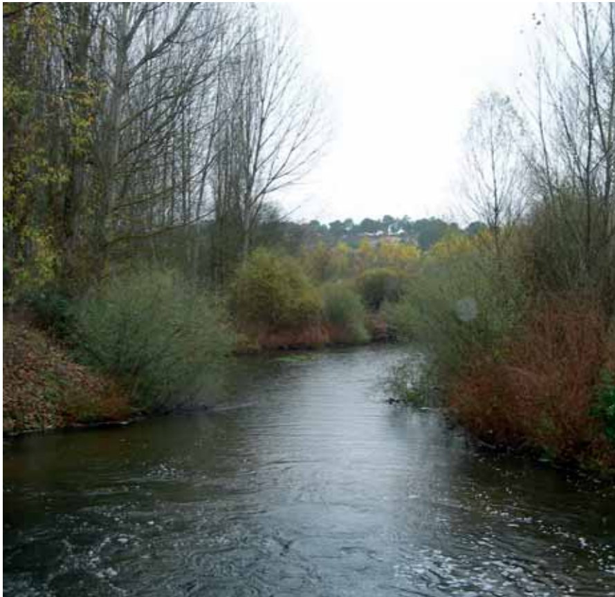
La Campiña Segoviana cuenta con excelentes valores naturales.

La alta calidad de los productos agroalimentarios permite un trabajo en común con otras comarcas para su promoción y puesta en valor como herramienta de desarrollo económico