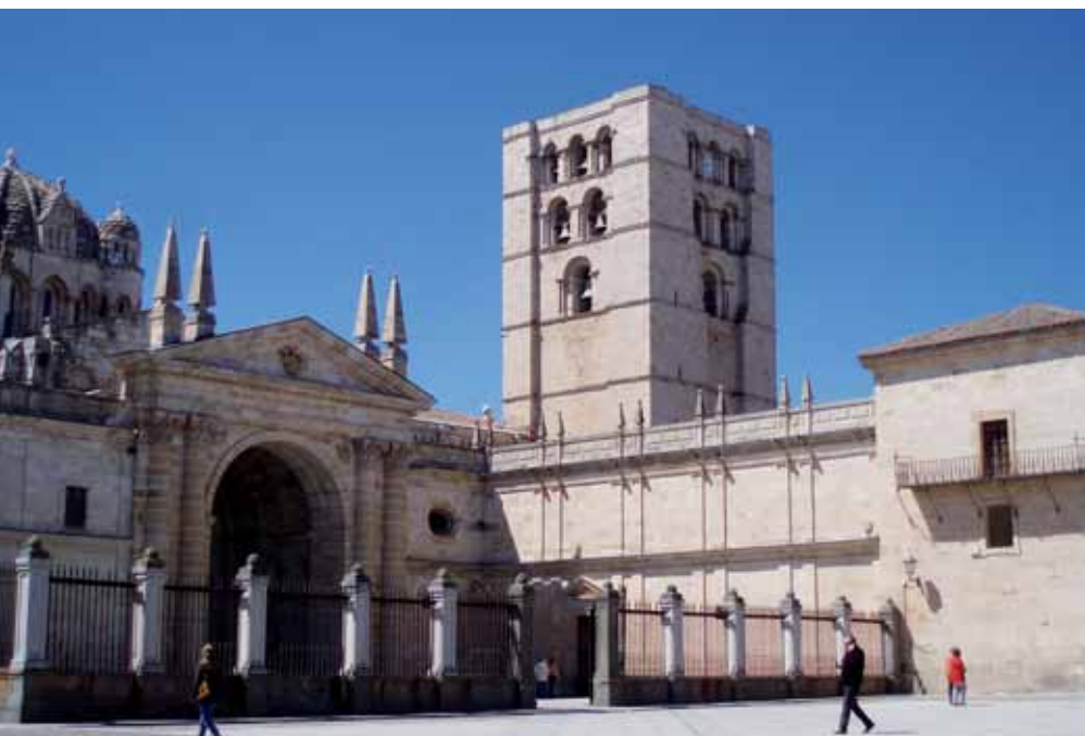
Catedral de Zamora, emblema del denominado románico del Duero.

cisterciense de San Martín de Castañeda, con su bella iglesia románica, se ubica una de las dos Casas del Parque que informan sobre el espacio natural. Destaca asimismo la Reserva Natural de las Lagunas de Villafáfila, uno de los humedales más destacables de la península.