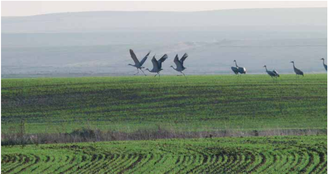
Grullas en el entorno de las lagunas de Villafáfila.

La riqueza medioambiental derivada del complejo lagunar y las materias primas obtenidas en el campo, así como su elaboración, son el motor de desarrollo del nordeste de Zamora