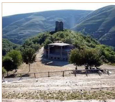
El auditorio al aire libre al pie del castillo de Balboa.