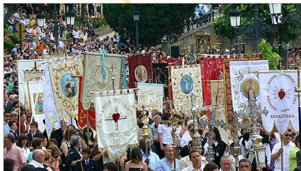
Los pendones e insignias dan un especial colorido a las procesiones de Salida y Entrada del Santo.

A las procesiones de la Salida y Entrada del Santo acuden todos los párrocos del arciprestazgo del Boeza y autoridades , con insignias , cruces y pendones portados por los vecinos de los pueblos respectivos.