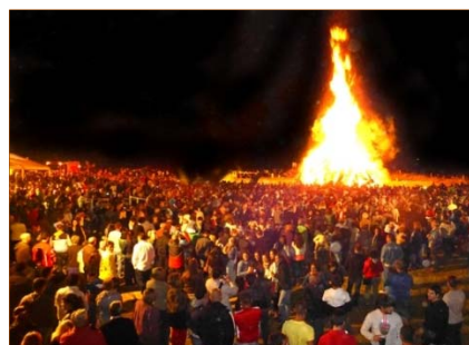
La gran hoguera de San Juan de la Mata.