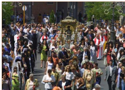
Momento de la procesión en 2008.

La fiesta se celebra cada siete años y consiste en el traslado de la imagen del 'Ecce Homo' desde su santuario hasta la iglesia parroquial . En esta ermita permanece nueve días en los que se celebra el correspondiente novenario , y se cierra con el retorno de la imagen al santuario.