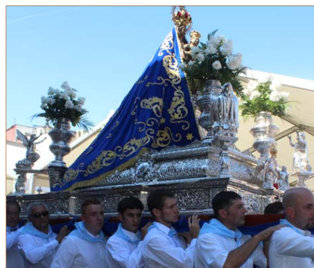
Habitantes de Sobrado llevaron en procesión a la 'Morenica'.

En cuanto a la celebración religiosa, la comitiva que acompañó este año a la ' Morenica ' el 'día grande' durante su procesión, fue una delegación de las poblaciones del municipio de Sobrado , encargado este año de la ofrenda de productos tradicionales de la huerta berciana y sobre todo castañas , a Ntra. Señora de la Encina en nombre de toda la comarca.