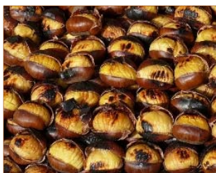
Castañas ya asadas.

En cualquier caso, se trata de una celebración no religiosa tradicional en la que familiares y amistades se reúnen para dar la bienvenida al frío, calentando el cuerpo con las castañas asadas y los primeros vinos de la última cosecha realizada.