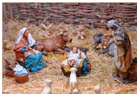
Detalle del Nacimiento artesano.

- Desde que comienza el mes de diciembre y hasta que finalice enero , como cada año, ¡y ya irán cincuenta y uno!, abrirá sus puertas el tradicional nacimiento artesano en la localidad de Folgozo de la Ribera , declarado de interés turístico provincial desde el año 2000 .