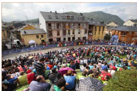
La cuesta del castillo de Ponferrada durante la prueba reina del campeonato.

Miguel Induráin, presidente de honor del Mundial declaró que "España y Ponferrada han respondido a las expectativas que se habían creado en torno a ellas como se esperaba, a un excelente nivel". Deportivamente, el murciano Alejandro Valverde se colgó la medalla de bronce en la prueba de fondo de la categoría élite.