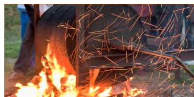
Asando castañas en un tambor.

La fiesta consiste en realizar una hoguera y, sobre sus llamas o sus brasas, se coloca un cilindro metálico agujereado (bombo, chambombo, tambor...) o una sarten agujereada en la base (tixolo o tixola).