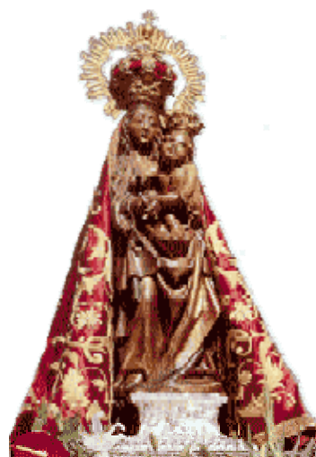
Imagen de la Virgen de la Encina.

Ambos son los dos días festivos locales establecidos por decreto de la alcaldía, en el calendario laboral de Ponferrada, trasladándose a fecha diferente si coincidieran en sábado o domingo.