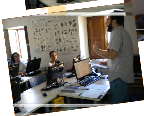
Imágenes de la primera jornada del Proyecto Salida realizada en el municipio de Carracedelo.