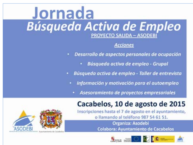
Cartel anunciador de la jornada realizada en Cacabelos.

La Asociación para el Desarrollo de la Comarca Berciana (Asodebi), como Grupo de Acción Local de la comarca del Bierzo , ha puesto en marcha el proyecto Salida (Servicio de Asistencia Laboral y de Iniciativas Dirigidas al Autoempleo) con el que se ha pretendido proporcionar atención y asesoramiento a las personas desempleadas para su itinerario profesional. Las personas usuarias han contado con apoyo técnico orientador para su búsqueda de empleo , proporcionando las pautas necesarias para adaptar las estrategias y técnicas utilizadas a las necesidades y características de cada demandante de empleo .