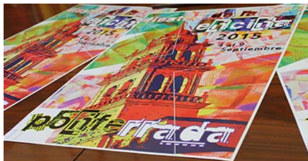
Cartel de las fiestas de la Encina 2015 durante su presentación.

Los eventos y celebraciones acostumbran a durar en torno a 10 días en los que permanece abierto el recinto ferial, y en los que Ponferrada se llena de mercadillos, exposiciones, muestras gastronómicas, música popular, actos religiosos, teatro de calle, conciertos, competiciones deportivas y fuegos artificiales . Eventos entre los que destacan la Feria internacional de la cerámica ; la Ciudad Mágica (CIMA) , para las y los más jóvenes; y los conciertos de las «Noches de la Encina» que este año traen a la capital comarcal a Víctor Manuel y Ana Belén , el grupo Maldita Nerea , bandas que rinden tributos a Queen y Los Beatles , y además un musical llamado «El rey de la sabana, el león» que nos presenta la historia de dos hermanos enfrentados, siguiendo el éxito internacional del musical basado en la producción de Disney «El rey león».