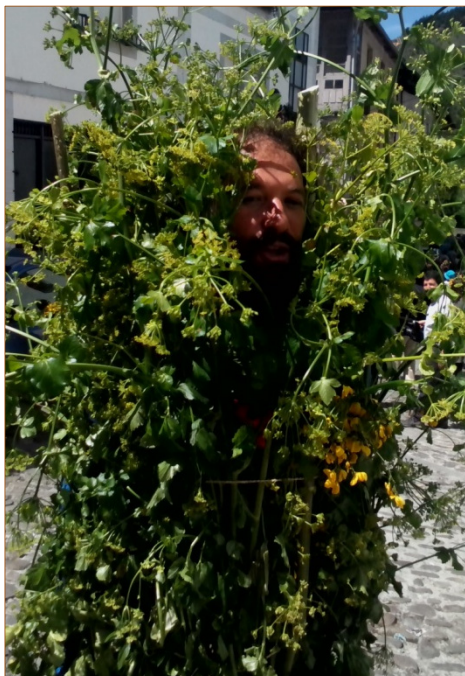
Un 'maio' de Villafranca del Bierzo.

El 1 de mayo Villafranca del Bierzo volvió a cumplir con la tradición pagana por excelencia del municipio, la fiesta de los ' maios ', que es la única de carácter humano de Castilla y León que goza del reconocimiento de Interés Turístico Provincial . Se trata de un ritual ancestral que evoca la llegada de la primavera después de un largo y duro invierno, y canta al reverdecer de la naturaleza y al resurgir de las flores. Jóvenes del pueblo se atavían con cañaveiras o mazandones y recorren las principales calles de la villa del Burgia entonando varios cánticos bajo los balcones, con la misma melodía y que se repiten continuamente para que todos y todas participen, de los que volaron caramelos y propinas , algunas en forma de castañas secas , tradición que todavía a día de hoy se mantiene.