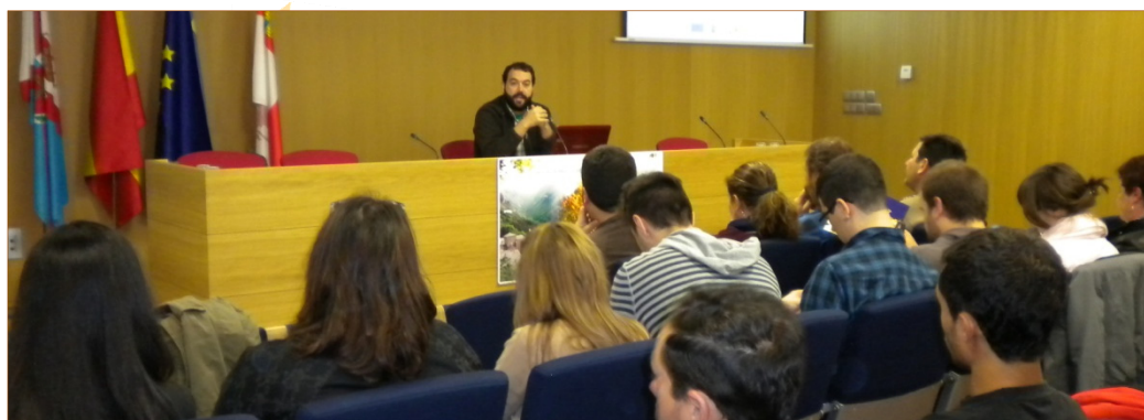
Momento de la presentación del 'Acercamiento al Turismo Ornitológico' previa a la clausura del proyecto de cooperación TRINO en la comarca del Bierzo.

La Jornada se cerró con la participación de los asistentes al acto a quienes se solicitó su colaboración y expresando su opinión sobre los puntos fuertes y débiles del proyecto que se encontraba próximo a finalizar, así como planteando sus propias propuestas para tomar nota de todo ello y, si fuese posible en un futuro, implementarlo en el proyecto TRINO en un nuevo periodo de programación.