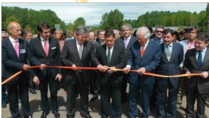
Inauguración de la feria por el Pte. de la Diputación de León.

Este año además la feria se enfocó en un factor fundamental en este momento, la exportación . Así, países de Sudamérica, Europa central y Portugal son hoy puntos de mercado que mantienen activo el sector. Ello se abordó en el seminario ' Claves en la exportación de productos agroalimentarios ', impartido por expertos en comercio internacional en la Casa Rectoral de Carracedelo , sede de cinco de los marchamos de calidad del Bierzo .