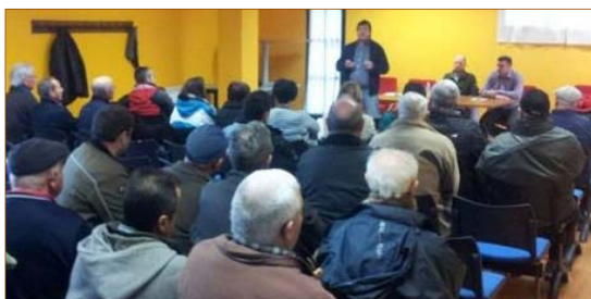
Castañicultores/as durante la sesión.

El pasado 4 de marzo tuvo lugar en Villalibre de la Jurisdicción (Priaranza del Bierzo), una sesión informativa convocada por la Mesa del castaño , la Marca de Garantía Cstaña del Bierzo , Cesefor y la Asociación Berciana de Agricultores , dirigida a las y los castañicultores de la comarca con el fin de animarles a asociarse. Con el ejemplo del proyecto asociativo 'Castaños de Las Médulas', se les propuso una forma diferente a la tradicional de impulsar y rentabilizar el cultivo de los sotos, y mejorar la comercialización haciéndose un hueco en el mercado actual. Se propusieron nuevas formas de gestión, más profesionales y sostenibles, y se presentó la M.G. como medio de protección de quien produce y quien consume.