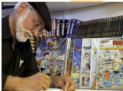
Jan, firmado ejemplares de sus obras.

El dibujante berciano Juan López Fernández, más conocido como 'Jan', natural de Toral de los Vados y creador de personajes como 'Super López', 'Pulgarcito' o 'Don Talarico', ha sido galardonado con el ' Botillo de Oro 2014 '. Con este premio, el Partido del Bierzo reconoce desde hace 28 años a aquellos colectivos, personas, asociaciones e instituciones que luchan y destacan por su entrega, contribución y realce de las gentes que viven en el Bierzo, así como por dar a conocer nuestra comarca fuera de ella.