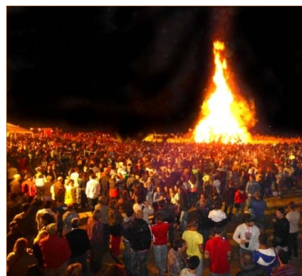
La gran hoguera del año 2013.

Además, coincidiendo con el solsticio de verano , y por tanto con la noche más corta del año, tienen lugar en muchas poblaciones de la comarca del Bierzo, celebraciones alrededor de las hogueras en la noche de San Juan . Destaca entre ellas la celebrada en San Juan de la Mata (Arganza) que año tras año persigue batir un nuevo record de la hoguera más grande del mundo .