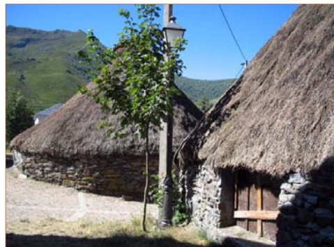
Pallozas en una localidad de Candín.

320 habitantes (INE 2013) repartidos en 11 poblaciones ( Balouta, Candín, Espinareda de Ancares, Lumeras, Pereda de Ancares, Sorbeira, Suarbol, Suertes, Tejedo de Ancares, Villarbón y Villasumil ) a lo largo de 140,90 Km 2 , hacen de Candín el 6º municipio más grande de la comarca, y el 2º menos poblado.