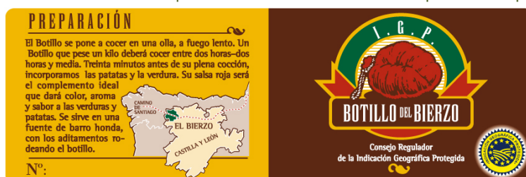
Marchamo del Consejo Regulador de la I.G.P. 'Botillo del Bierzo'.

La trazabilidad del producto queda garantizada por el distintivo numerado y controlado por el Consejo Regulador del que van provistos todos los Botillos del Bierzo que se comercializan amparados por la I.G.P.