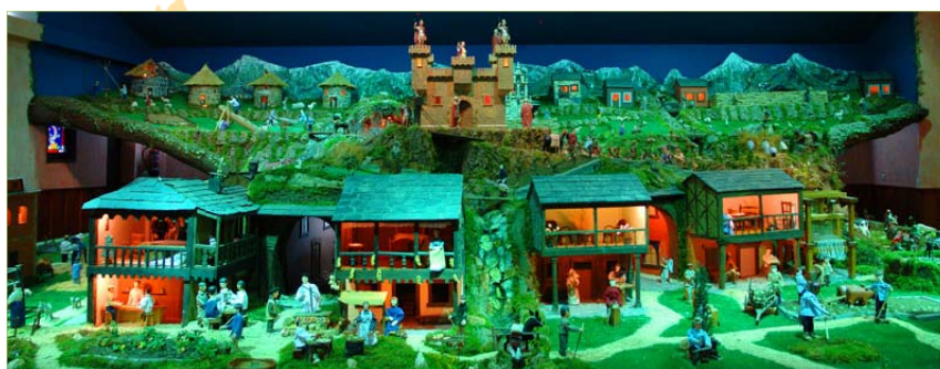
Vista general del Nacimiento artesano.

"En febrero las figuras se paran y toca recoger, se cierra el Nacimiento... no definitivamente, por supuesto; sólo quiero hacer una reflexión: ¿Por qué no será siempre Navidad? ... ¡Eso depende de nosotros!"