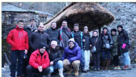
L@s bloguer@s posando.

Algunos de los blogueros más importantes de toda España relacionados con la gastronomía y los viajes se dieron cita en el Bierzo durante los días 8 y 9 de febrero en un 'blogtrip' (viaje de blogueros) en el que tuvieron la oportunidad de descubrir parte de nuestra comarca.