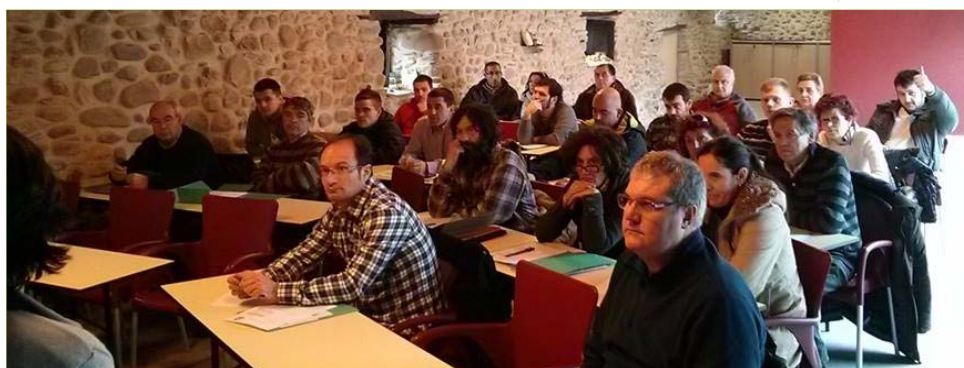
El alumnado del curso en el aula.

De los días 17 a 27 de febrero se celebró en horario de tarde y en las instalaciones de la Asociación Berciana de Agricultores (ABA) en Carracedelo, un curso de ' Iniciación a la fruticultura y viticultura ' destinado a demandantes y arrendatarios/as del Banco de Tierras y a socios/os de la ABA. Finalmente el curso tuvo que iniciarse con cinco alumn@s más de lo previsto debido al gran número de solicitudes recibidas (30 en lugar de 25).