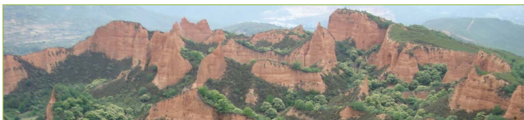
Vista parcial del yacimiento aurífero desde el mirador de Orellán.

Las poblaciones del municipio cuentan con varios negocios de restauración y alojamientos turísticos que se benefician de su proximidad a las minas de oro de la época romana de Las Médulas , y reciben a los visitantes que pueden disfrutar de la tradicional vista del yacimiento Patrimonio de la Humanidad desde el mirador de Orellán y disfrutar de una visita al pasado adentrándose en la conocida como ' galería de Orellán '.