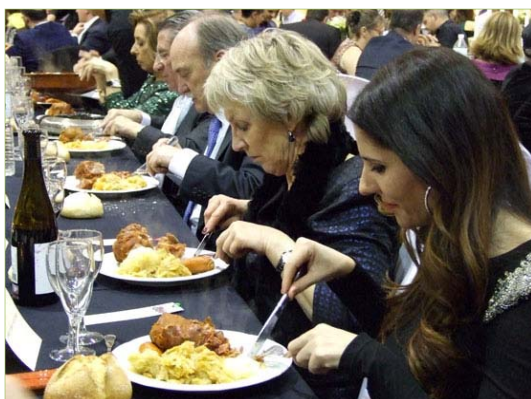
Las y los comensales iniciando la degustación del botillo acompañado de repollo y chorizo.