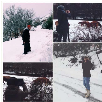
La nieve impidió visitar Balouta.

Alojados en dos enclaves fundamentales de 'nuestro' Camino de Santiago , como son Cacabelos y Villafranca del Bierzo , la jornada del día 8 comenzó con la visita a la Reserva de la Biosfera de Los Ancares . En primer lugar visitaron Balboa , disfrutando de la Casa de las Gentes y su pallozas dedicada a la restauración donde saborearon dulces de harina de castaña que les sorprendieron. Posteriormente se dirigieron hacia el puerto de Ancares pasando por Vega de Espinareda , donde visitaron el Monasterio de San Andrés , y continuaron el camino hacia el ayuntamiento de Candín , visitando las poblaciones de Tejedo de Ancares y posteriormente Pereda de Ancares . Por desgracia, a causa de las nevadas ocurridas en esos días y anteponiendo la seguridad del grupo, no se pudo ascender el puerto para luego dirigirse al incomparable pueblo de Balouta .