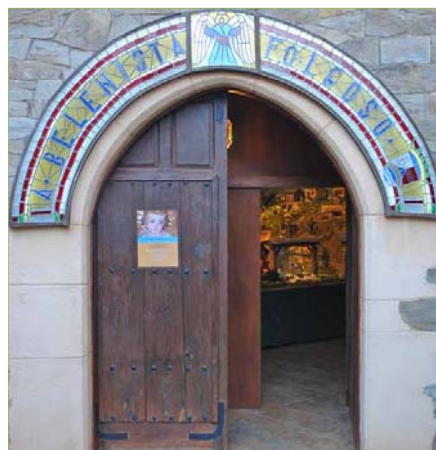
Entrada al edificio del Nacimiento.

Además, ese mismo año, el Ayuntamiento solicita la declaración del nacimiento como Fiesta de Interés Turístico Provincial y así lo acuerda la Diputación Provincial de León en un año en el que además se donan terrenos junto a la iglesia de Folgoso de la Ribera para la construcción de un edificio en el que se instalará el Nacimiento de más de 80 m 2 de modo permanente desde 2001 .