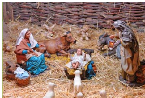
Detalle del Nacimiento en el que se representa al niño Jesús. (Foto: www.nacimiento.folgoso.com )

La historia de éste Belén artesano comienza en 1963 , cuando un párroco y una profesora, con ayuda de algunas otras personas, instalan un Nacimiento frente a la sacristía de la iglesia parroquial. La primera innovación fue dotar al río de agua corriente , para lo cual se debía repostar con frecuencia una cuba a caldero.